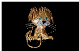
VAN CLEEF & ARPELS Broche «lionceau» Adjugé 2 700 €