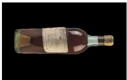
Bouteille de Château d'Yquem Lur Saluces, 1940 Adjugé 700 €