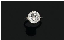
Bague en or blanc 18K Diamant rond Adjugé 32 500 €