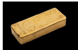
Lingot d'or 997,0 / 10 000 Adjugé 32 900 €