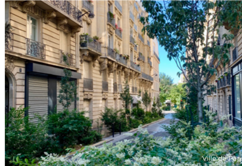
Rue Pierre Haret