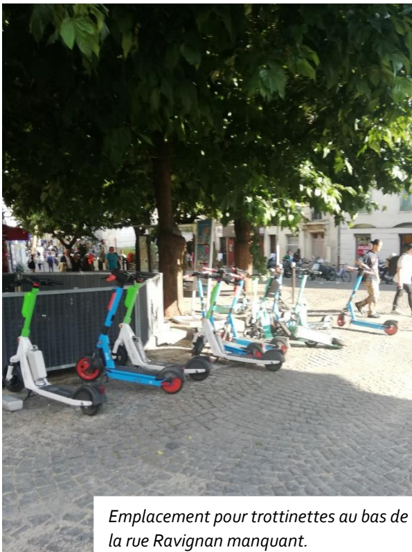
Emplacement pour trottinettes au bas de la rue Ravignan manquant.