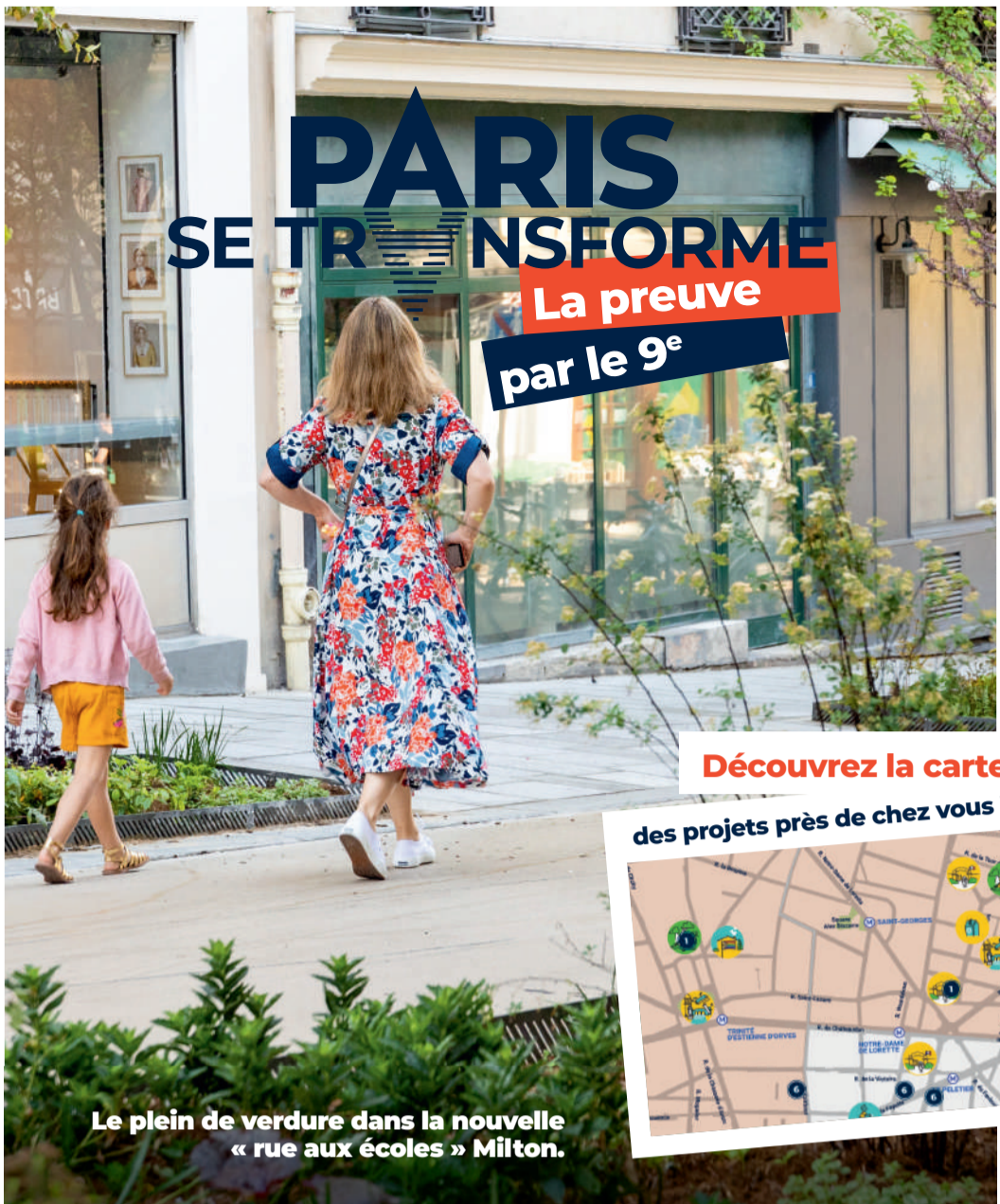
Le plein de verdure dans la nouvelle « rue aux écoles » Milton.

Edition novembre 2022 - Direction de la communication de la Ville de Paris - Conception : © www.groupeurouve.fr - 77961 - Crédits photographiques : Guillaume Bontemps / Ville de Paris ; Gérard Sanz / Ville de Paris ; Clément Douval / Ville de Paris ; Laurent Bourgogne / Ville de Paris ; Laurent Bajer / DPMP Ville de Paris ; Emmaüs Solidarité - Ne pas jeter sur la voie publique - Imprimé sur papier recyclé