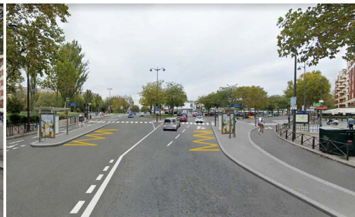
Photomontage de l'état projeté