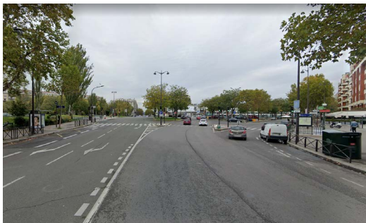
Photographie de l'état actuel

⚠ Des arceaux pour les vélos et vélo-cargos seront mis en place, ponctuellement sur le linéaire et rues adjacentes.