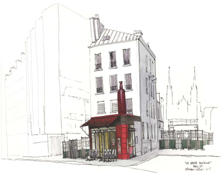
Dessin de Cendrine BONAMI-REDLER, extrait du livre « Dans son jus - Voyage sur les zincs » de Patrick BARD et Cendrine BONAMI-REDLER, Edition Elytis, août 2018.

Il se précipita sur son téléphone. Les premières réponses, quoique aimables, ne furent pas à la hauteur de ses attentes, à savoir : « C'est quoi cette Bouteille ? », « Vous n'êtes pas au bon numéro... », « La mairie n'est pas une succursale des objets trouvés »,