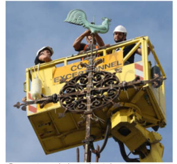
Démontage de la croix et du coq

Nos remerciements à M. Charvet (DECH) et M. Lodier (photos).