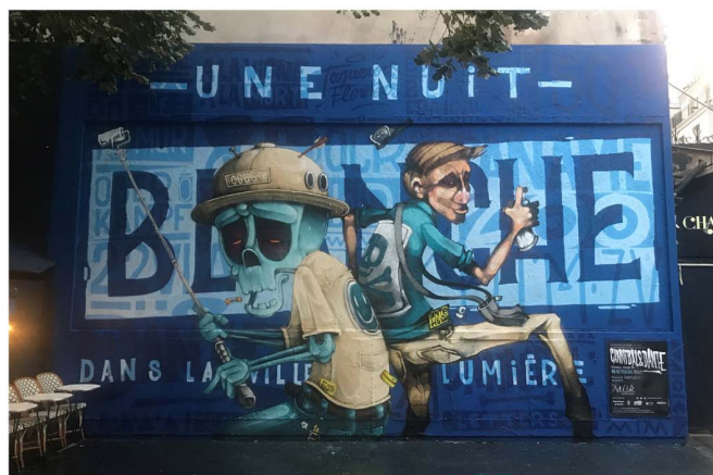
Image du mur en octobre 2019

Trois principes structurent l'action : le lieu, qui doit être unique, la rémunération des artistes pour leur œuvre et la sélection réservée aux seuls artistes urbains. D'autres initiatives proches de l'association Le M.U.R. existent maintenant en France et en Europe.