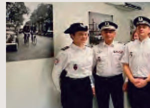
Cérémonie d'installation Commissaire divisionnaire l'Inspecteur général Bern Paris

La Mairie du 8 e a organisé avec les acteurs culturels le 1 er forum de la Culture de l'arrondissement, réunissant musées, théâtres, centres culturels afin d'échanger avec le public et dévoiler leurs programmations 2023. L'Inspectrice de l'Éducation nationale et plusieurs enseignants s'y sont déplacés aux côtés des habitants