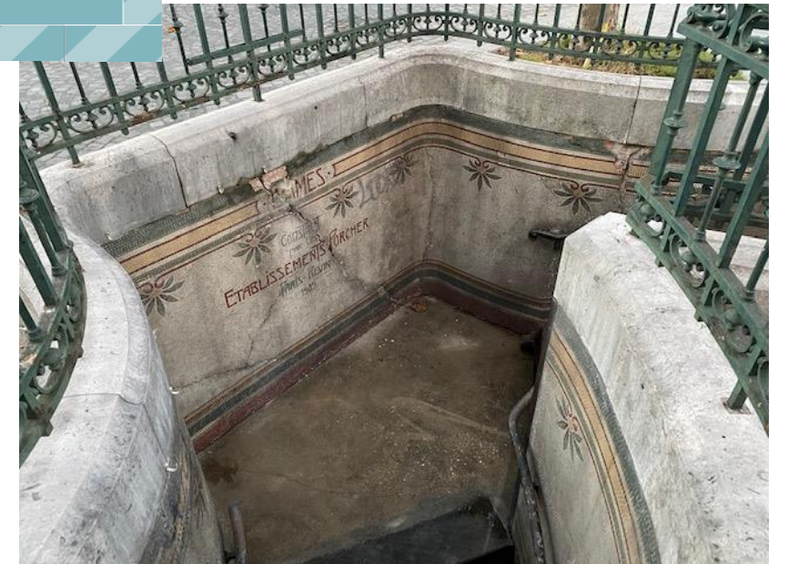
Escalier d'accès au lavatory qui a fait l'objet de sondages géotechniques