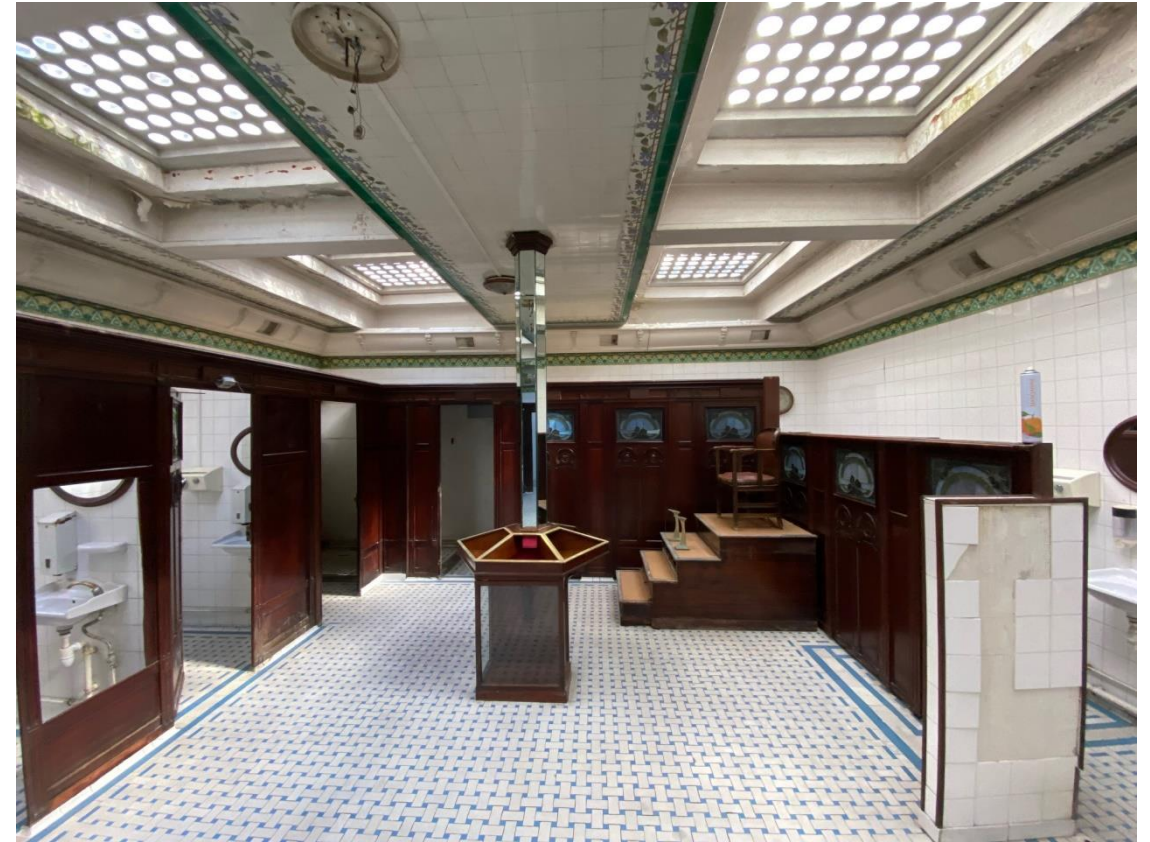
Lavatory entièrement nettoyé durant l'été 2021 / En cours de finition