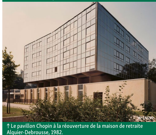
↑ Le pavillon Chopin à la réouverture de la maison de retraite Alquier-Debrousse, 1982.