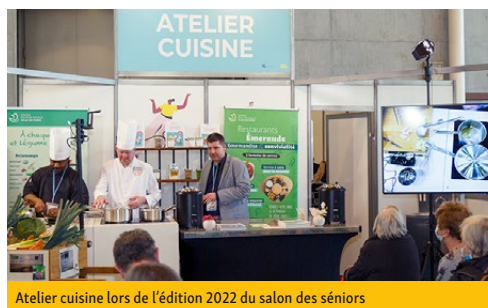
Atelier cuisine lors de l'édition 2022 du salon des séniors

Pour sa nouvelle édition, le Salon des Séniors vous donne rendez-vous du 22 au 25 mars 2023 à Paris, Porte de Versailles, hall 2.2. De nombreuses informations et animations vous attendent. Ce salon national accueille chaque année plus de 30000 visiteurs venus de toute la France, grand public ou professionnels (santé, loisirs, logement...). Vous y découvrirez des idées de loisirs, des conseils sur