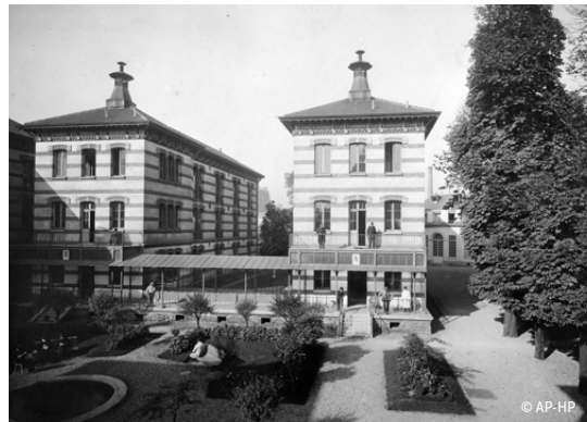
↑ Bâtiments de l'hospice, années 1900.

à ce qu'il était en 1980 par exemple. L'administration doit sans cesse innover pour répondre aux besoins des résident-e-s, qui évoluent au gré des générations. Dans peu de temps, les airs d'accordéon dans les bals laisseront place aux tubes des années 80 ! Les Ehpad sont maintenant équipés du Wifi, car cela correspond aux envies et besoins d'une nouvelle génération. Aujourd'hui, nous constatons aussi un mouvement d'ouverture de ces établissements sur leur quartier, à travers des activités en lien avec les associations locales, etc. On se tourne aussi de plus en plus vers les activités intergénérationnelles. L'exemple du passé montre que la société évolue et le profil des résident-e-s avec. Les maisons de retraite doivent donc s'adapter au mieux à leurs nouveaux besoins et à leur place dans cette société.