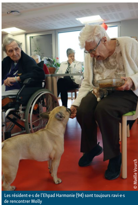
Les résident·e·s de l'Ehpad Harmonie (94) sont toujours ravi·e·s de rencontrer Molly