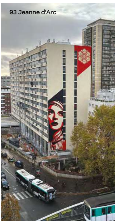
93 Jeanne d'Arc

sables pour le confort des locataires. L'enveloppe du bâti a ainsi bénéficié d'une isolation par l'extérieur avec le remplacement de l'intégralité des menuiseries. La RIVP a également fait le choix de poser des volets pliants-couissants sur la façade côté rue et des volets roulants sur la façade côté jardin. À l'intérieur des logements, les sanitaires et l'installation électrique ont été refaits à neuf. Ces améliorations du confort thermique induisent une baisse des charges énergétiques, le tout sans impact sur les loyers.