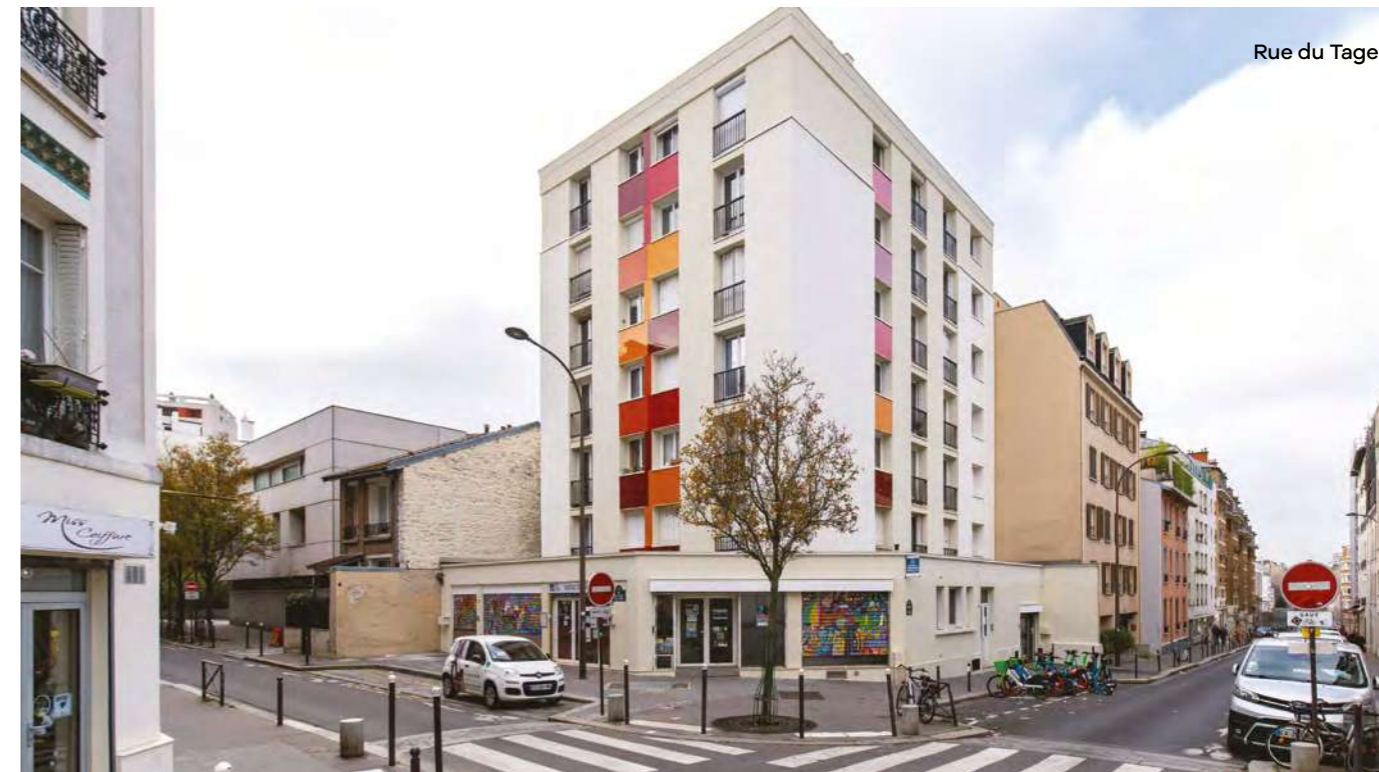
Rue du Tage