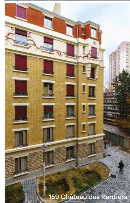
159 Château des Rentiers