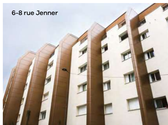
6-8 rue Jenner

Elle attendait cette réhabilitation depuis longtemps et elle n'est pas déçue : « la façade est superbe, c'est une véritable transformation ! ». Dans le logement qu'elle occupe, la pièce d'eau, la cuisine et la peinture ont été refaites. Les anciennes menuiseries ont été remplacées par des fenêtres en aluminium et assorties de persiennes. Selon Claude, « l'appartement est beaucoup plus agréable à vivre malgré une petite perte d'espace ». L'isolation thermique est également à la hauteur de ses espérances. « J'ai même été obligée d'arrêter mes radiateurs ». Seul petit bémol, le manque d'ergonomie de la nouvelle porte d'entrée. Mais Claude est déjà sur le coup !