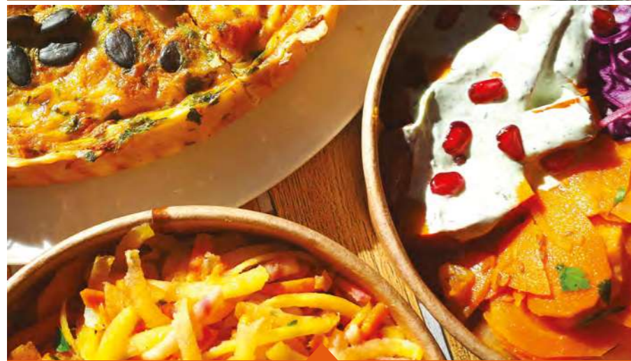
UN MIDI AU MOULIN