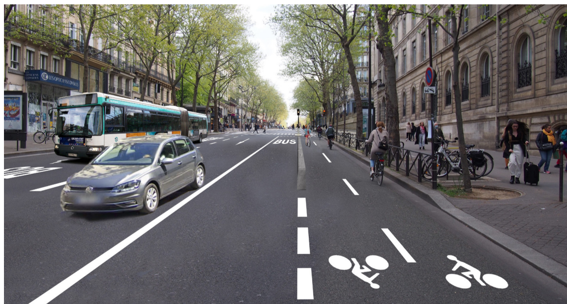
Photomontage du projet