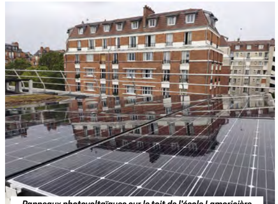
Panneaux photovoltaïques sur le toit de l'école Lamoricière

Ce mois-ci commence la révision du Plan Climat de Paris, qui sera adopté en 2024 et à laquelle vous êtes toutes et tous invité-es à participer. Après un été marqué par des épisodes de chaleur intenses, par de multiples incendies et par des records de sécheresse, l'accélération de la transition écologique à toutes les échelles est une priorité. A Paris, l'actualisation du plan climat permettra de renforcer son ambition. Construit comme un plan d'actions devant être opérationnel d'ici 2030, il doit mettre en œuvre les objectifs de réduction de 50 % des émissions de gaz à effet de serre, de 35 % des consommations d'énergie et d'atteindre 45 % d'énergies renouvelables.