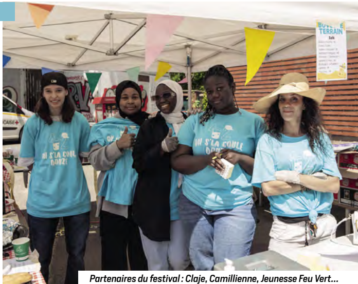
Partenaires du festival : Claje, Camillienne, Jeunesse Feu Vert...

Le festival par et pour les jeunes du 12 e arrondissement a fait son retour les 10 et 11 juin après deux ans d'absence. Cette grande fête est un moment emblématique pour la jeunesse et la culture du 12 e . Une programmation artistique qui cette année encore a montré la diversité de nos talents locaux. Nouveauté de cette édition, un village de l'engagement était présent toute la journée pour valoriser les bénévoles mais aussi afin de permettre aux jeunes participant-es de trouver des moyens de s'engager.