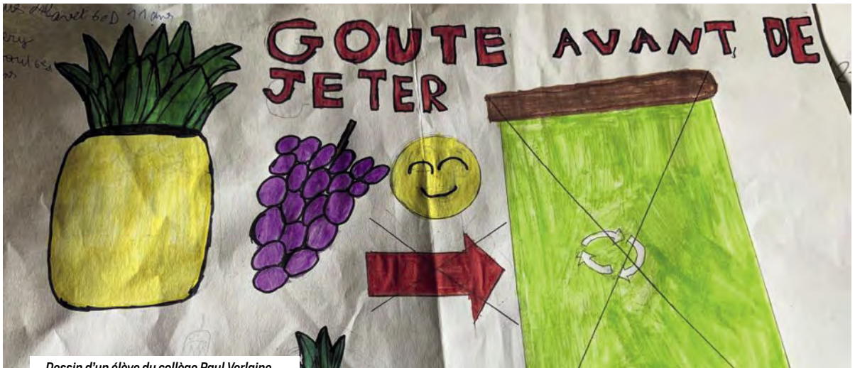
Dessin d'un élève du collège Paul Verlaine

De l'éducation alimentaire avec l'organisation d'ateliers « petit-déjeuner équilibré » préparés et animés par la diététicienne – nutritionniste de la CDE.