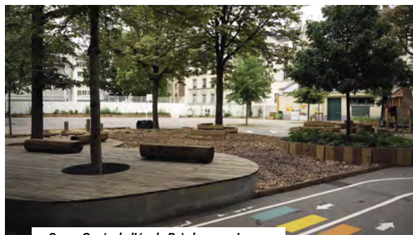
Cours Oasis de l'école Brèche-aux-Loups

En 2021, la transformation des cours d'école en cours Oasis figurait dans les quatre projets lauréats du Budget Participatif dans le 12 e arrondissement.