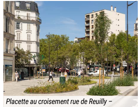
Placette au croisement rue de Reuilly – rue de Chaligny

refonte du plan de circulation, réduisant le trafic de transit, contribuera également à la réduction de la pollution atmosphérique et sonore.