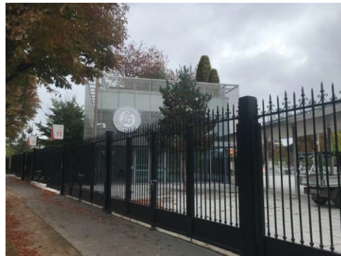
PAS D'IMPACT VISUEL DEPUIS LA RUE