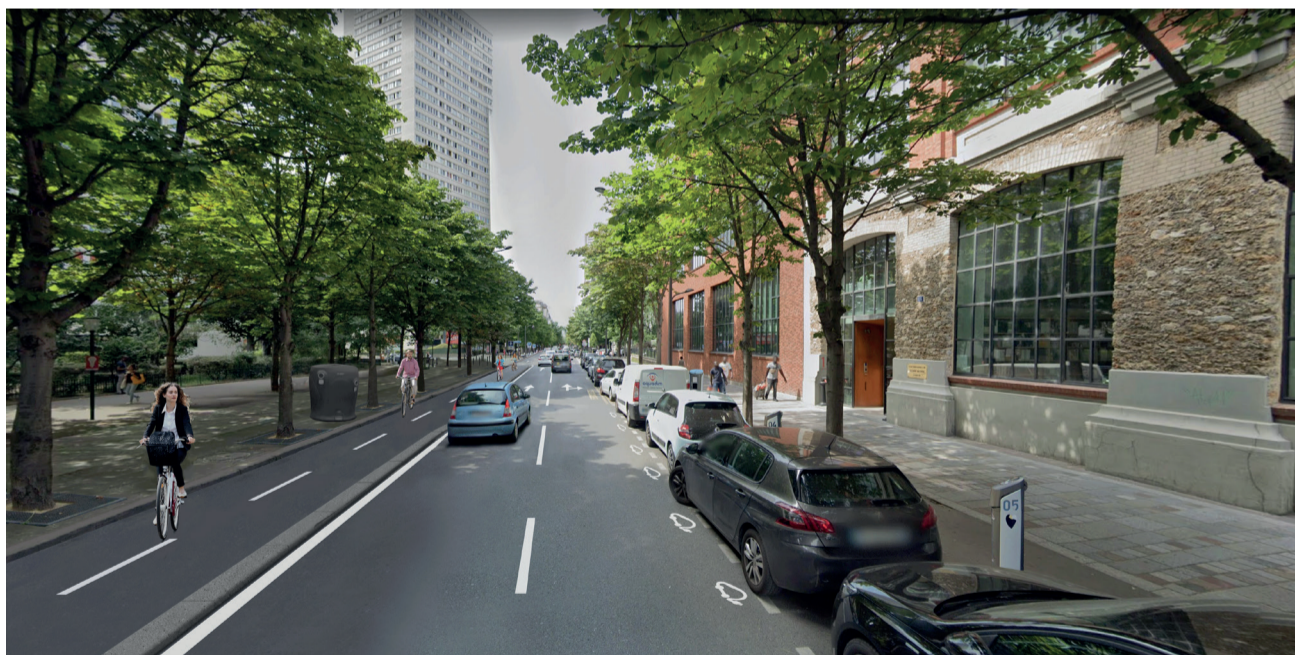
Photomontage du projet d'aménagement