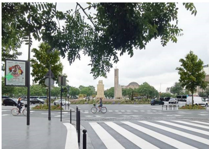
Photomontage du projet