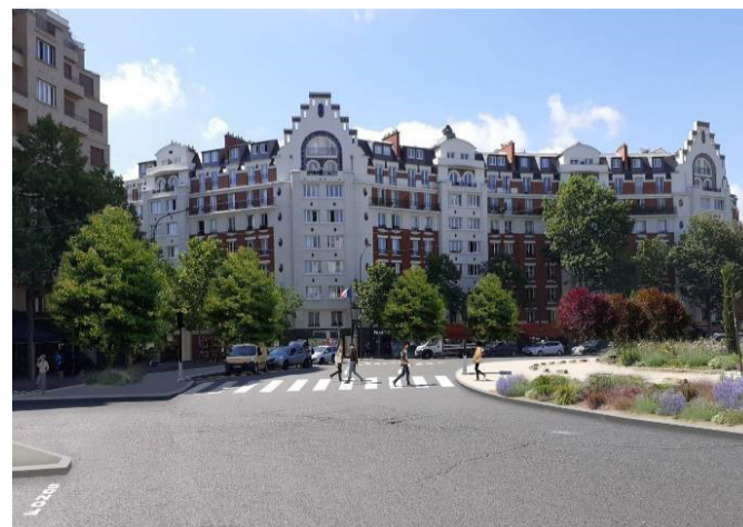
Photomontage du projet