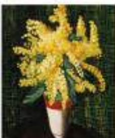
M. KISLING Vendu 92 300 €