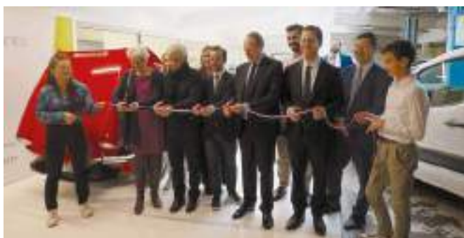
Inauguration de « REV Mobilities », leader européen du rétrofit électrique