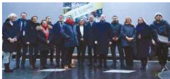
Départ du 100 e camion de dons à destination de l'Ukraine, avec le concours de l'association SAFE et en présence du ministre-conseiller de l'ambassade d'Ukraine