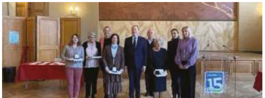
« Bénévolat au cœur » décoration de représentants d'associations investies dans l'action sociale