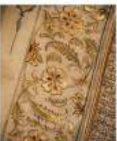
Coron en Ghubari Vendu 54 600 €