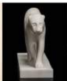
F. POMPON Vendu 145 000 €