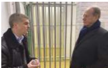
Visite à 35 mètres de profondeur d'un abri antiatomique de 800m 2 qui héberge les serveurs de données sensibles de grandes entreprises françaises