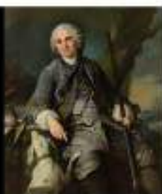
L. TOCQUE Vendu 162 500 €