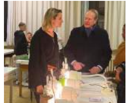
Fête de la science au collège Modigliani