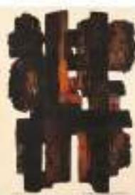
P. SOULAGES Vendu 65 000 €