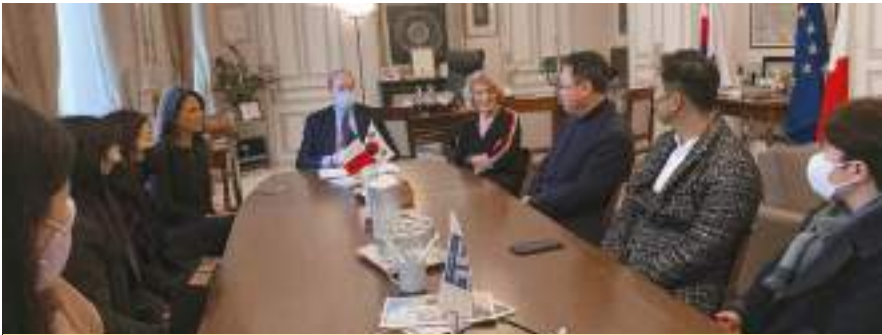
Accueil en Mairie de représentants du gouvernement de Séoul et du district de Seocho jumelé avec le 15 e