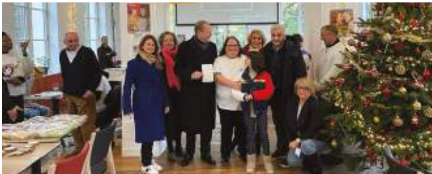
Évènement « Handicap, mets ta cape » à l'espace Voie 15, dans le cadre du Téléthon