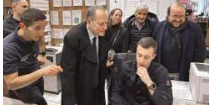
Aux côtés des pompiers de la 6 e compagnie pour examiner le dispositif de sécurité de la nuit de la Saint-Sylvestre