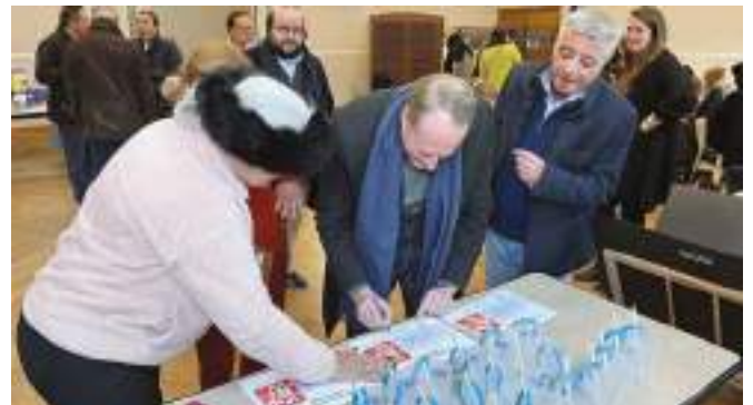
6 e édition du salon « Enlivrez-moi » de la littérature jeunesse