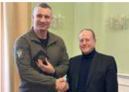
Remise de la médaille du 15 e à Vitaliy Klychko, Maire de Kyiv, lors de la visite officielle de Philippe Goujon en Ukraine