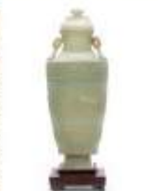
CHINE, XVIII e Vendu 68 300 €