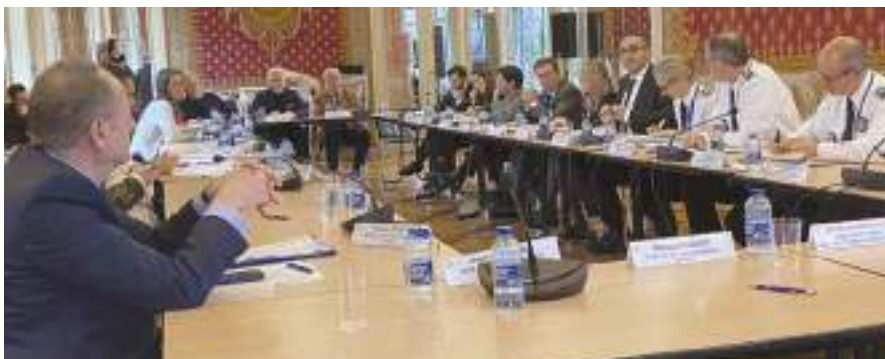
Réunion sur la sécurité à Paris présidée par le Préfet de Police, Laurent Nuñez