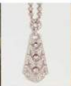
VAN CLEEF & ARPELS Vendu 364 000 €