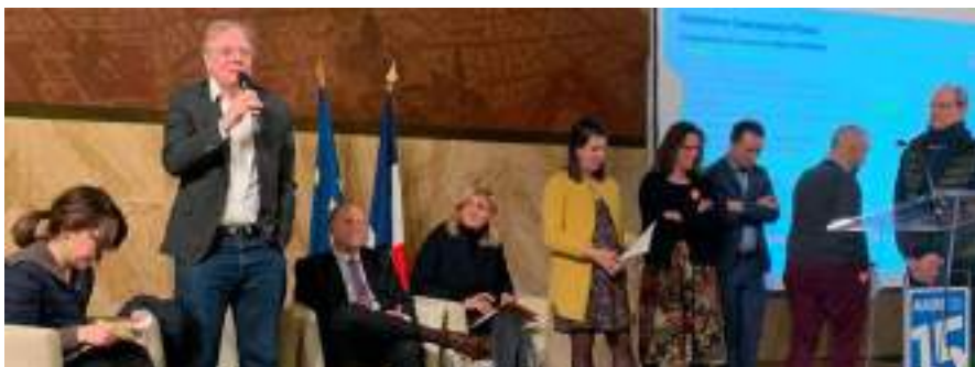
Réunion publique sur la rénovation énergétique des bâtiments dans le cadre du dispositif Eco rénovons Paris +