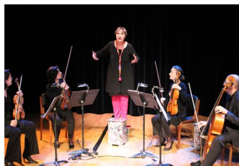
THÉÂTRE, Petit Poucet Théâtre Darius Milhaud