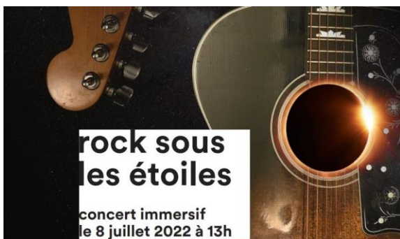
MUSIQUE, Rock sous les étoiles Cité des sciences et de l'industrie

Transformé en salle de concert, le planétarium célèbre l'été avec une représentation musicale, accompagnée d'images projetées sur la voûte. Une séance insolite à vivre en musique et en images.