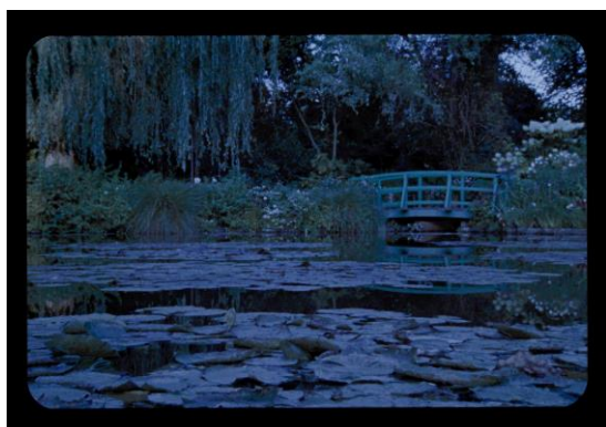
Meadow Report 2021 Film 35 mm, couleur et son © Marine Hugonnier