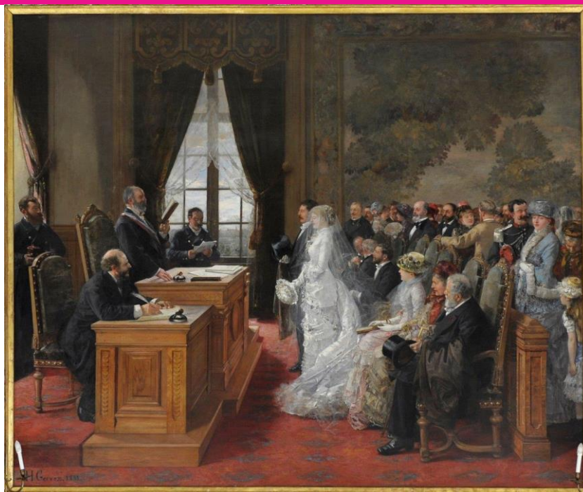
Henri Gervex, Le Mariage Civil