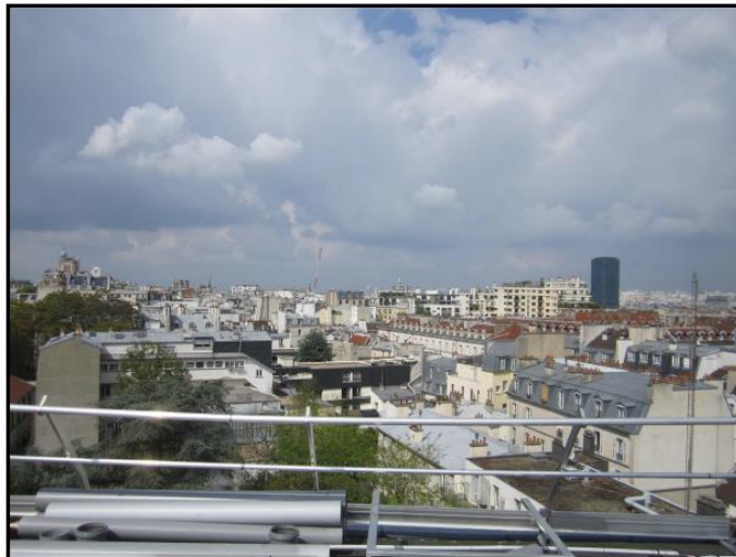
Azimut 2 : 250°