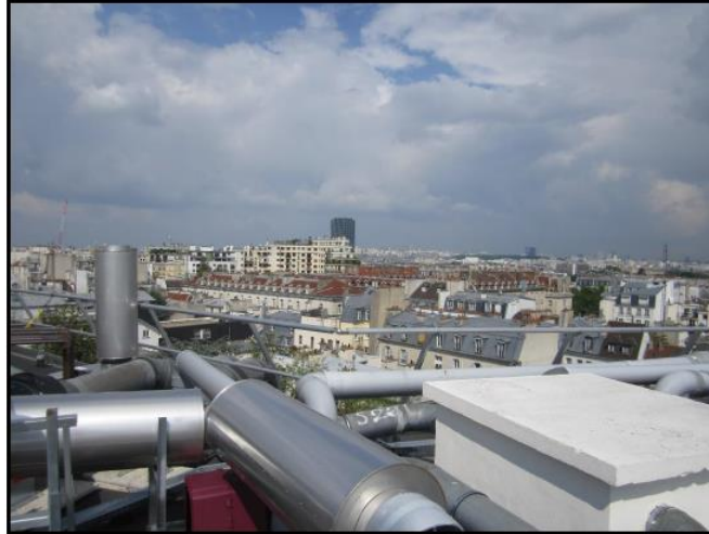
Azimut 1 : 140°