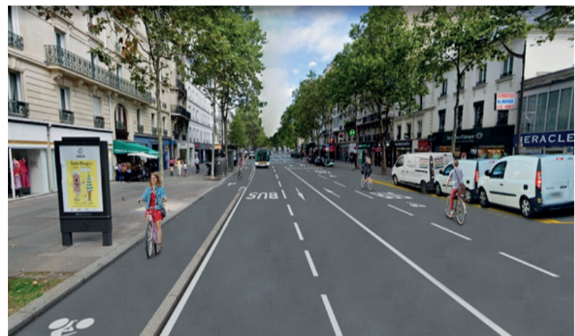
Photomontage du projet