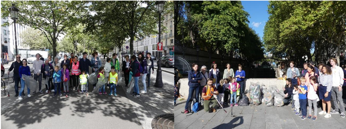
Clean Up Day (17 septembre 2022)

Face au constat du nombre important de déchets sur la voie publique, le Conseil de Quartier Bassin de la Villette a organisé, en coordination avec le Conseil de Quartier voisin Flandre Aubervilliers une séance de ramassage de déchets lors du Clean Up Day en septembre 2022 .