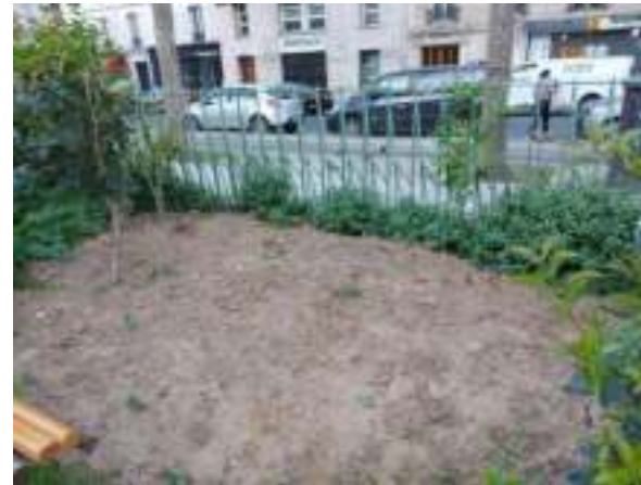
Terre à nu