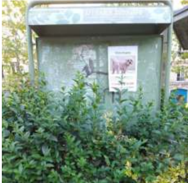
Le 21 avril 2022

Sympa d'avoir pensé à un panneau d'affichage pour les associations. Hélas !