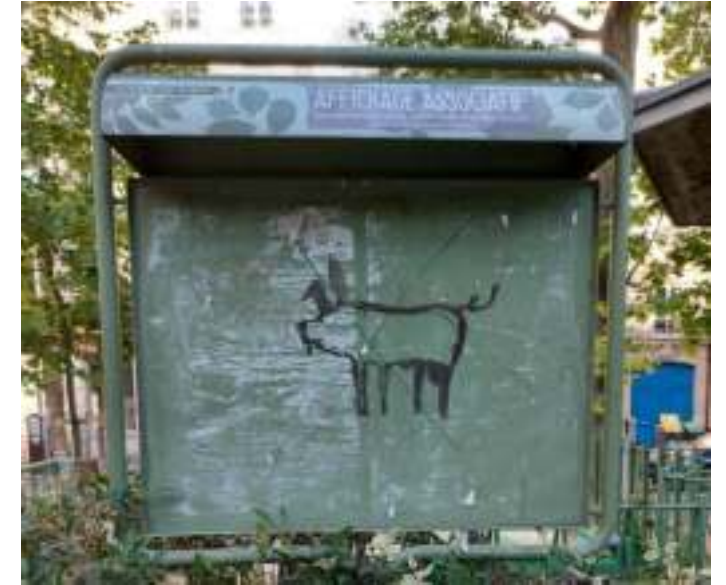
Et maintenant !