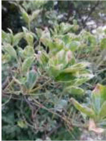
Des plantes malades ?