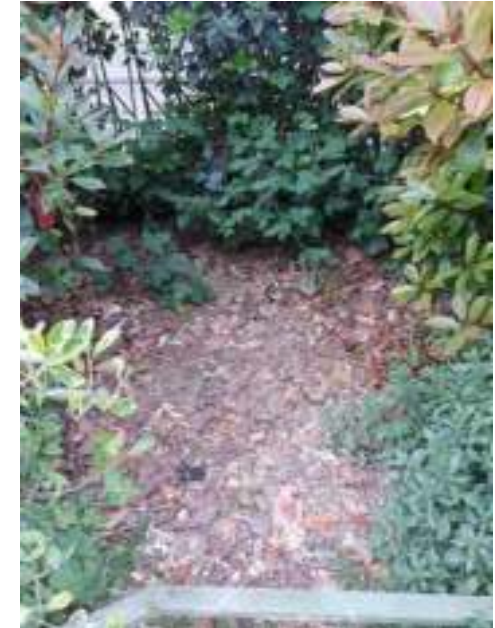
Un peu protégée par des écorces