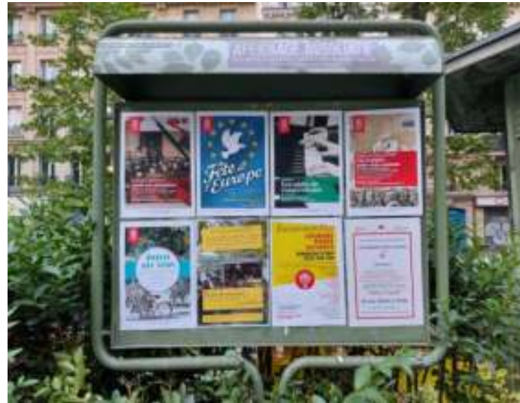
Une quinzaine de jours après