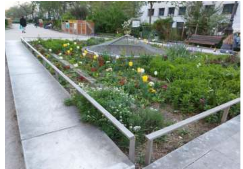
Les parterres sont même fleuris de tulipes