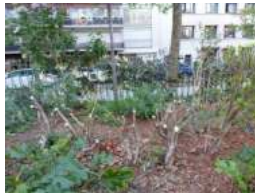
Taille drastique des buissons au printemps.

La taille au printemps est sans doute nécessaire. Ne pourrait-elle pas être plus modérée pour préserver l'abri et l'habitat de la petite faune (oiseaux).