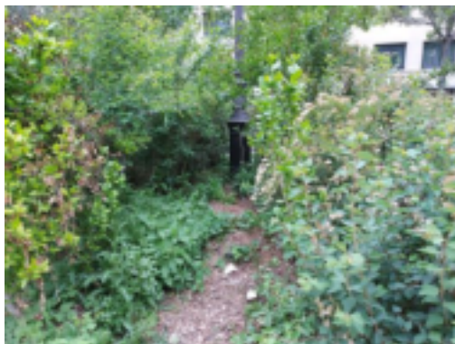
Un petit chemin, pratique pour pénétrer dans le massif.