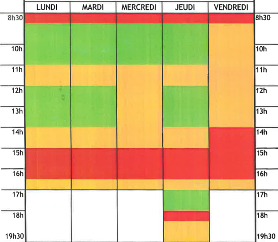
Service titres d'identité : temps d'attente pour le dépôt d'un dossier de demande d'un titre

: risque d'attente limité : risque d'attente modérée : risque d'attente importante