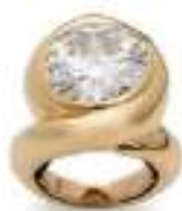
René BOVIN Adjugé 53 000 €