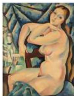
André L'HOTE Adjugé 220 000 €