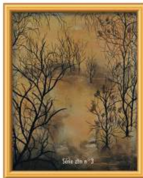
Série zen n°3

Visites à l'atelier sur rendez-vous (week-end inclus) 106, rue Jean de la Fontaine - 75016 PARIS