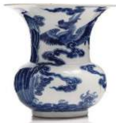
VIETNAM, XVIII e siècle Adjugé 112 000 €