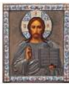
ICÔNE du Christ Pantocrator Adjugé 44 000 €