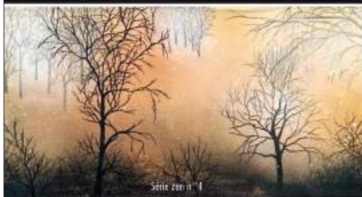
Série zen n°1