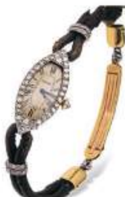
CARTIER Adjugé 17 200 €