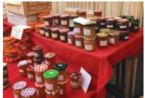
Cadeaux, livres, alimentation... : des stands multiples et variés.