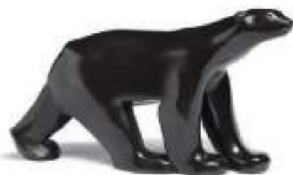
FOMPON Adjugé 33 500 €