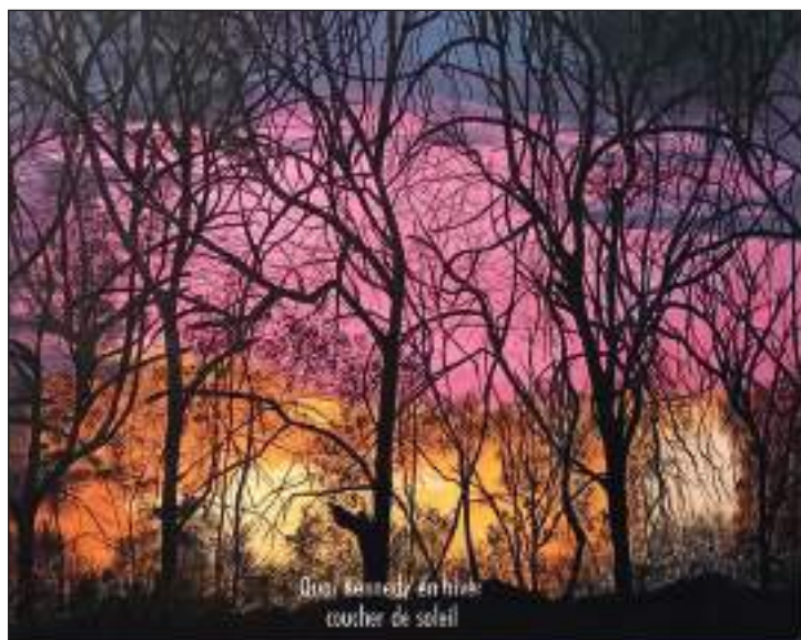
Dana Kennedy En hiver coucher de soleil