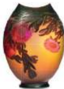
GALLÉ - Nancy Adjugé 15 000 €