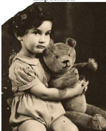
©Rosa Wurman-Wolf, maison d'enfants de Wezembeek, Belgique, durant la guerre