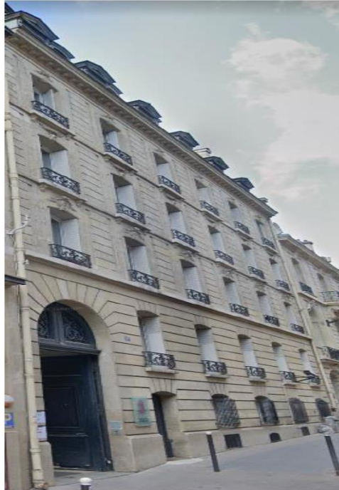
Photo du site vue depuis la rue avant travaux