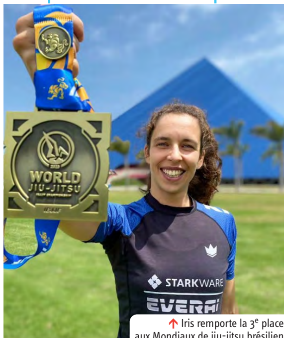
↑ Iris remporte la 3 e place aux Mondiaux de jiu-jitsu brésilien