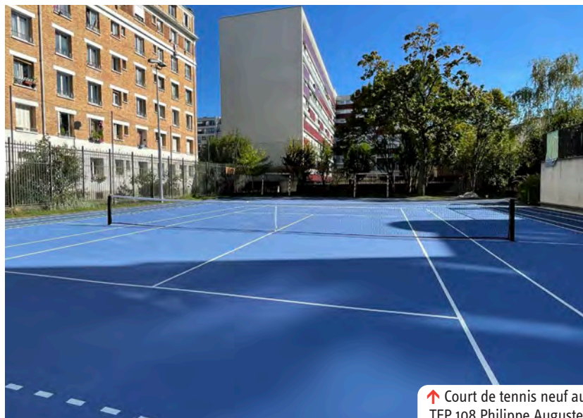
↑ Court de tennis neuf au TEP 108 Philippe Auguste.

→ Du 16 au 23 septembre Plus d'informations à venir sur mairie11.paris.fr