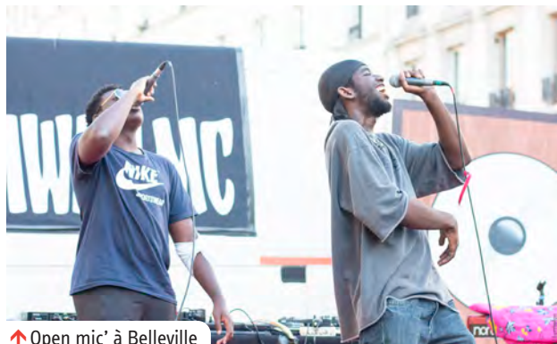
↑ Open mic' à Belleville