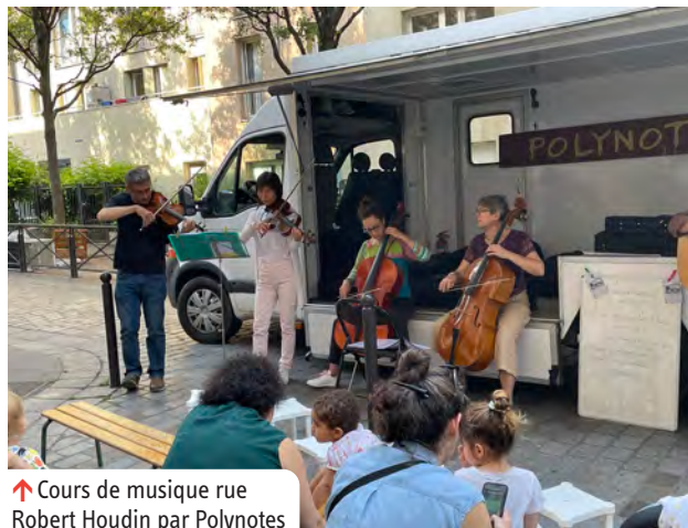
↑ Cours de musique rue Robert Houdin par Polynotes