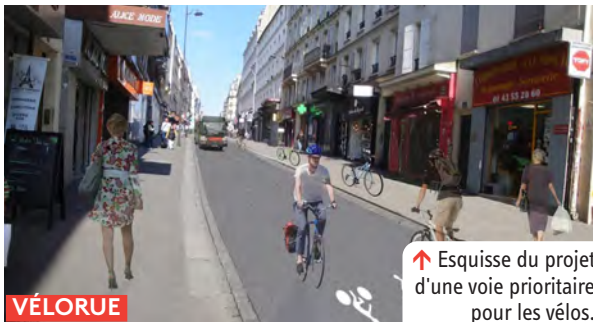
↑ Esquisse du projet d'une voie prioritaire pour les vélos.