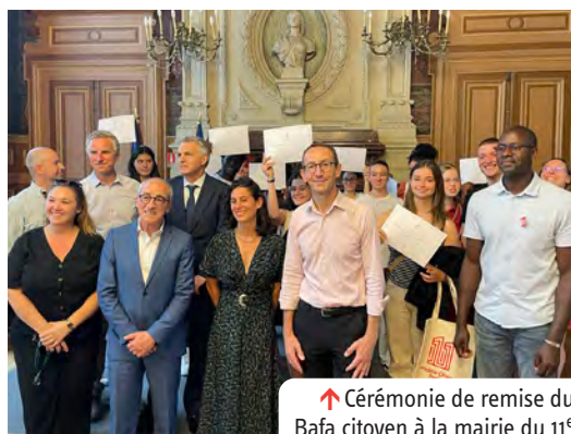
↑ Cérémonie de remise du Bafa citoyen à la mairie du 11 e

La Mairie du 11 e souhaite donner à chaque jeune de l'arrondissement les mêmes chances de réussite professionnelle. Pour trouver un emploi, la Mission locale est leur porte d'entrée. Les acteurs locaux accompagnent par ailleurs les jeunes de 11 à 18 ans dans la création d'associations et dans des projets d'autofinancement. C'est le cas notamment de Soligirls (pour les « filles solidaires »), une association soutenue par le centre social Solidarité Roquette qui prépare et livre des desserts. Elle utilise les fonds récoltés pour financer un départ en vacances. D'autre part, les clubs de prévention spécialisés, Jeunesse Feu Vert et Olga Spitzer, mettent en place des chantiers éducatifs : en salariant les jeunes et en leur confiant des missions d'intérêt général, ces structures responsabilisent les jeunes et leur donne les armes pour débiter dans la vie active. La Mairie du 11 e organise enfin chaque année le Forum Emploi, une journée dédiée à la mise en relation des demandeurs d'emploi avec les structures qui recrutent. Les jeunes y sont les bienvenus puisque de nombreuses offres d'emploi locales, de stage ou d'alternance y sont référencées.