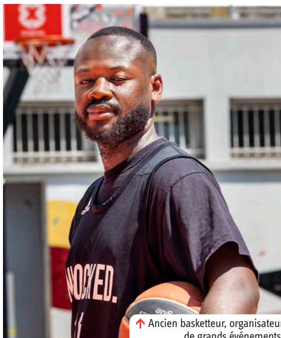
↑ Ancien basketteur, organisateur de grands événements.

mi-juin 2023 : obtention de la ceinture violette 2 juin 2023 : médaille de bronze au World jiu-jitsu Championship 8 mars 2022 : obtention de la ceinture bleue Février 2021 : premiers pas dans le jiu-jitsu brésilien