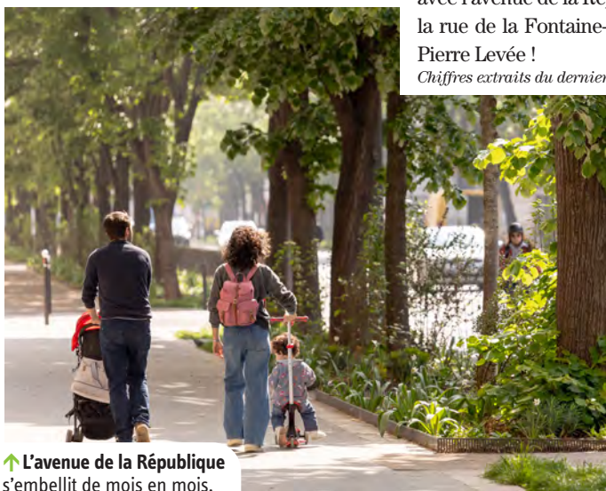
↑ L'avenue de la République s'embellit de mois en mois.