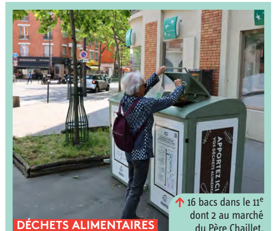
↑ 16 bacs dans le 11 e dont 2 au marché du Père Chaillet.

→ Plus d'informations sur le projet sur mairie11.paris.fr