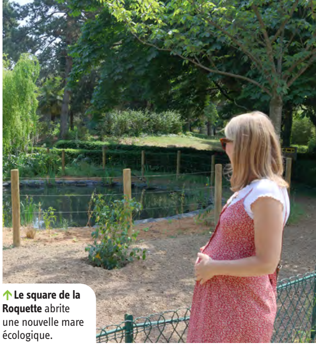
↑ Le square de la Roquette abrite une nouvelle mare écologique.