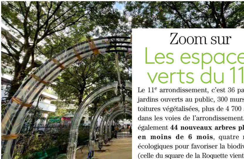
↑ Le square Georges Sarre est en cours de réaménagement (végétalisation des placettes, création d'une continuité piétonne et d'un terrain de foot, installation d'une pergola, agrandissement des aires de jeux).