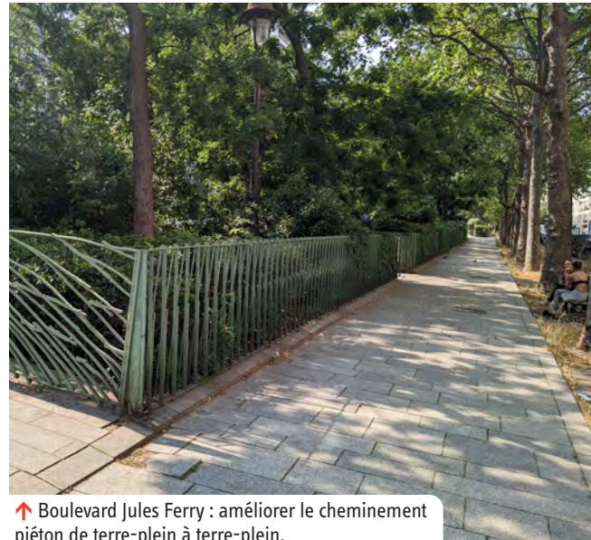
↑ Boulevard Jules Ferry : améliorer le cheminement piéton de terre-plein à terre-plein.

→ Plus d'informations sur le projet sur mairie11.paris.fr