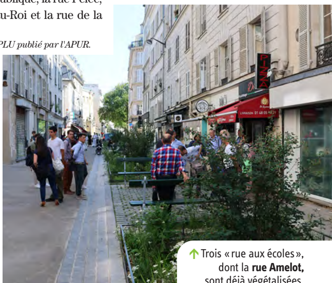
↑ Trois « rue aux écoles », dont la rue Amelot, sont déjà végétalisées.