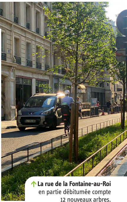
↑ La rue de la Fontaine-au-Roi en partie débitumée compte 12 nouveaux arbres.

Chiffres extraits du dernier PLU publié par l'APUR.