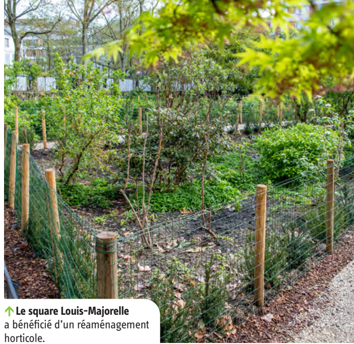
↑ Le square Louis-Majorelle a bénéficié d'un réaménagement horticole.