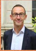
François VAUGLIN Maire du 11 e arrondissement de Paris