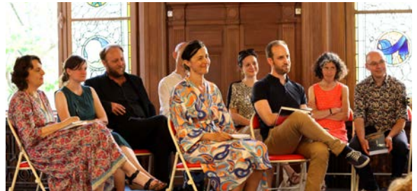
Les membres du jury constitué des bibliothécaires et libraires du 12 e arrondissement