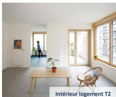
Intérieur logement T2