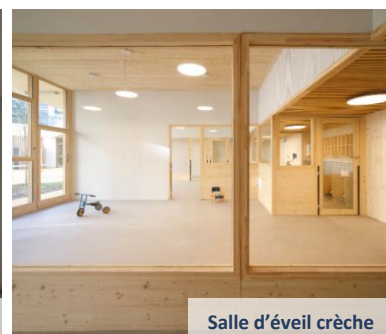
Salle d'éveil crèche