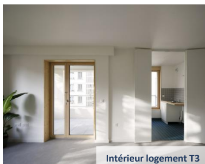
Intérieur logement T3