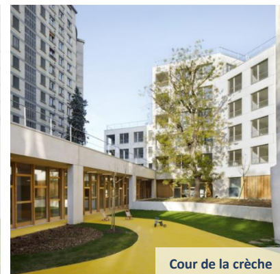
Cour de la crèche