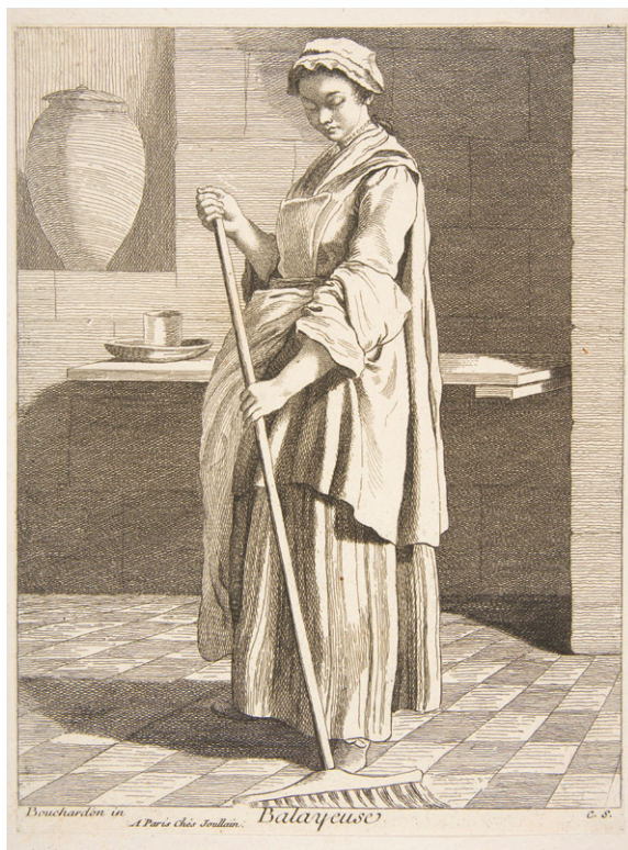
Badyeuse, Les Cuis de Paris, 1738 @ wikimedia commons 1904.