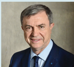
Jean-Pierre Lecoq Maire du 6 e arrondissement Conseiller régional d'Île-de-France