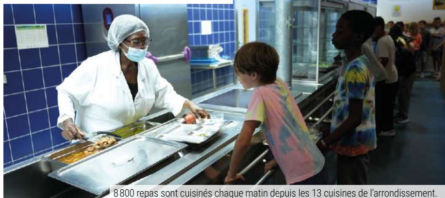
8800 repas sont cuisinés chaque matin depuis les 13 cuisines de l'arrondissement.

La Caisse des Écoles produit elle-même environ 8800 repas par jours cuisinés chaque matin pour 50 lieux de restauration, soit directement sur place, soit dans l'une des cuisines de production du 12 e . Dans ce cas, ils sont acheminés vers les écoles en « liaison chaude » et consommés dans les deux heures suivant leur préparation. Les menus sont élaborés par la diététicienne-nutritionniste de la Caisse des Écoles en collaboration avec les chef-fes de cuisines.