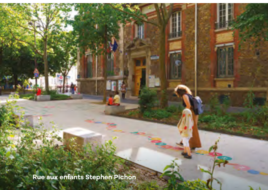
Rue aux enfants Stephen Pichon

Embellir votre quartier est un dispositif de concertation pour optimiser l'aménagement de l'espace public et conjuguer harmonieusement les différents usages !