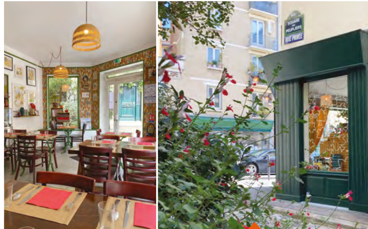
LA BONNE HEURE