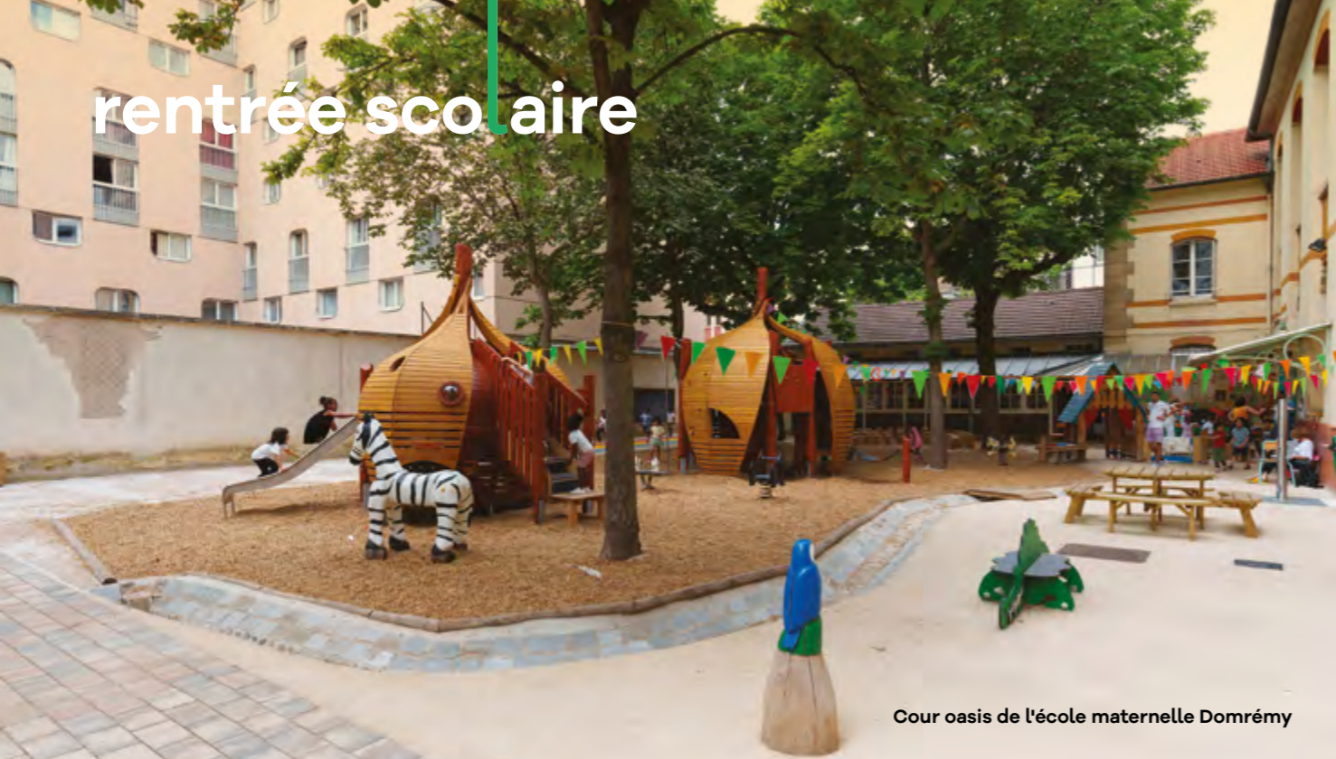
Cour oasis de l'école maternelle Domrémy