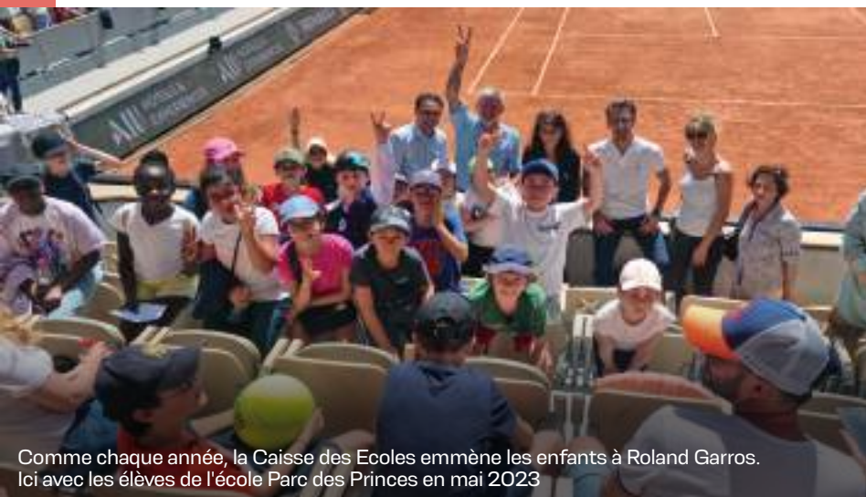
Comme chaque année, la Caisse des Ecoles emmène les enfants à Roland Garros. Ici avec les élèves de l'école Parc des Princes en mai 2023

Fidèle à la tradition sociale des caisses des écoles et en dépit du fait que la Ville de Paris ne finance plus l'action sociale des caisses, nous avons souhaité continuer mais également développer de nombreux projets, en lien avec les associations : lutte contre le gaspillage alimentaire, boîte éducative, relaxation, brain gym, éducation aux goûts et saveurs du monde... Par ailleurs, grâce à des partenariats innovants avec les clubs et fédérations sportives basés dans le XVI e , la caisse des écoles emmène depuis plusieurs années les enfants à Roland Garros, au Parc des Princes, au Stade Français, et même récemment au tournoi de tennis féminin du Lagardère. Nos excellentes relations avec les clubs et associations de l'arrondissement nous permettent de proposer régulièrement aux enfants des actions et projets autour du sport et des JOP. « Un esprit sain dans un corps sain » est bien la devise de notre caisse des écoles et le sera encore plus pendant toute la durée de la Coupe du Monde de Rugby.