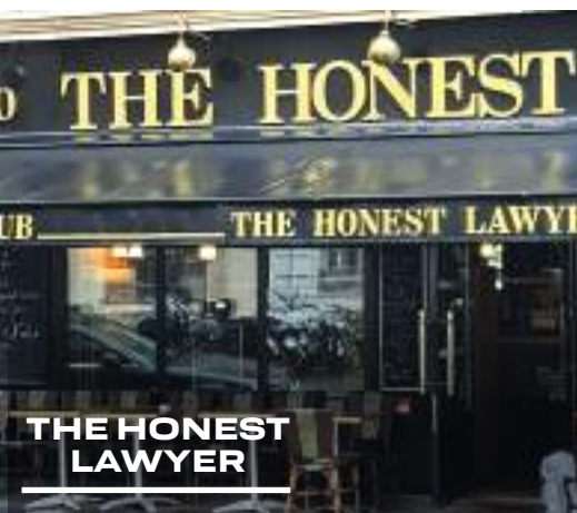
THE HONEST LAWYER