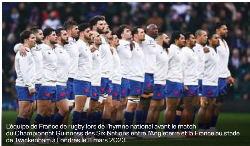
L'équipe de France de rugby lors de l'hymne national avant le match du Championnat Guinness des Six Nations entre l'Angleterre et la France au stade de Twickenham à Londres le 11 mars 2023

C'est en 1906 qu'a lieu le premier match officiel de l'équipe de France de rugby à XV qui affronte la Nouvelle-Zélande. Ces derniers remportent le match 38 à 8. L'Équipe de France participe pour la première fois au Tournoi des Cinq Nations en 1910. Le XV de France finit généralement dernier... Il faut attendre 1959 pour qu'elle remporte le tournoi (qui devient le Tournoi des Six Nations en 2000 avec l'entrée de l'Italie) et 1968 pour qu'elle décroche son premier Grand Chelem (terme utilisé lorsqu'une équipe gagne tous ses matchs lors d'un Tournoi des Six Nations ou d'une tournée contre des nations britanniques et irlandaise). L'équipe de France, trois fois finaliste de la Coupe du monde, est considérée aujourd'hui parmi les meilleures équipes de rugby de la planète, gagnant au fil de son histoire la réputation de pratiquer un jeu offensif très apprécié en France et à l'étranger, où on l'appelle le Beau jeu ou le French flair.