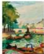
Albert MARGUET « Bords de Seine » Adjugé 70 000 €