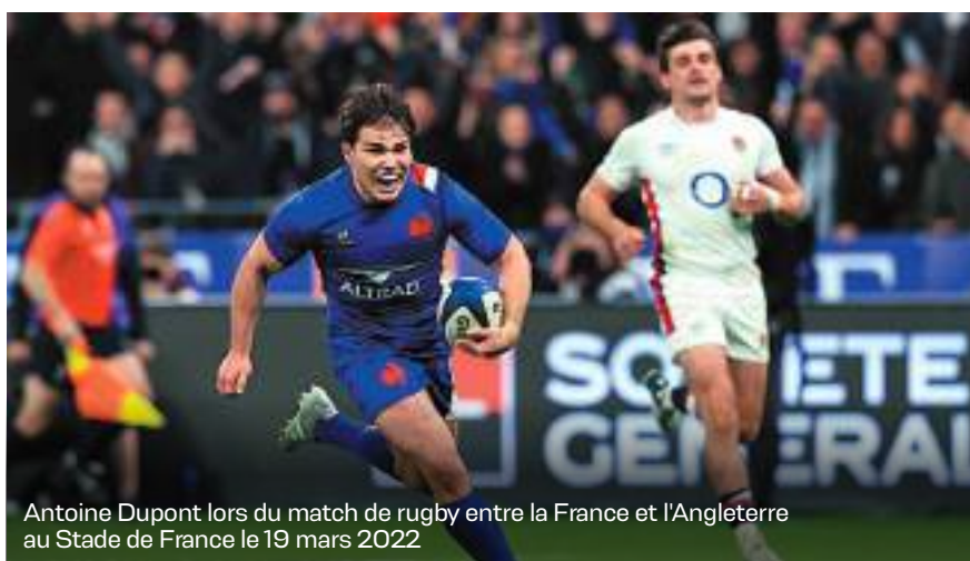
Antoine Dupont lors du match de rugby entre la France et l'Angleterre au Stade de France le 19 mars 2022