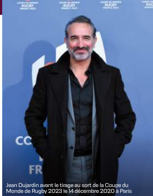
Jean Dujardin avant le tirage au sort de la Coupe du Monde de Rugby 2023 le 14 décembre 2020 à Paris