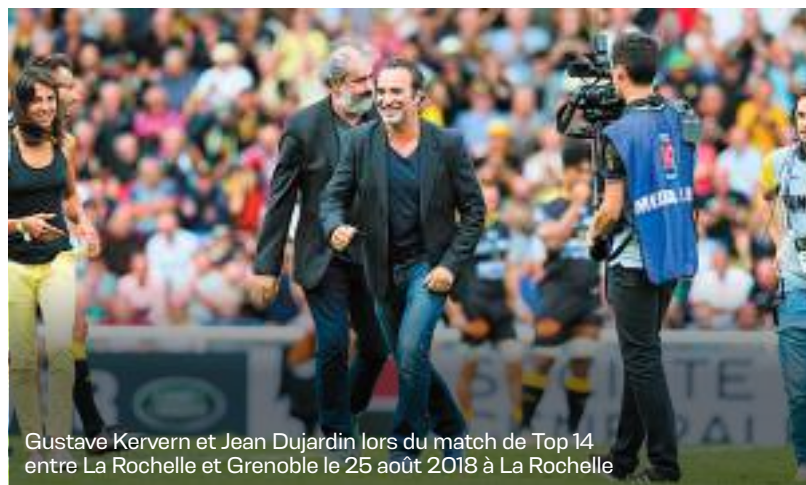
Gustave Kervern et Jean Dujardin lors du match de Top 14 entre La Rochelle et Grenoble le 25 août 2018 à La Rochelle

J'ai compris depuis longtemps que ce qui me plaisait, c'était d'être en mouvement. Je cours tout le temps.