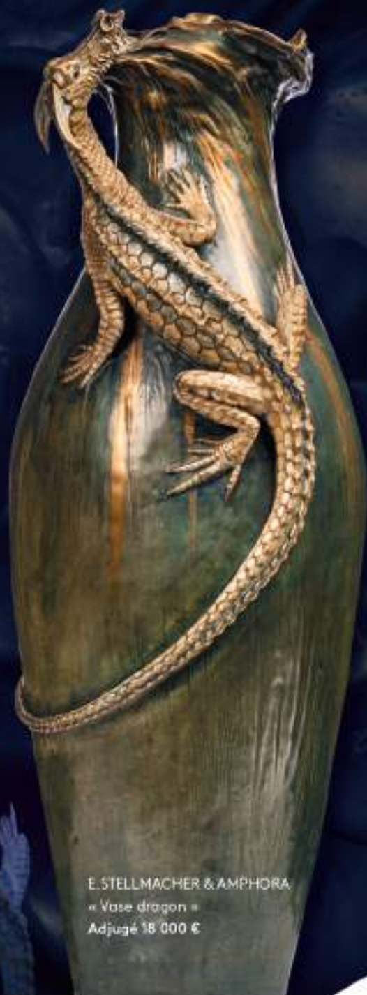
E. STELLMACHER & AMPHORA « Vase dragon » Adjugé 18 000 €

Tableaux anciens, modernes, contemporains, orientalisme, Middle East Arts décoratifs de 1880 à nos jours | Mobilier & objets d'Art Dessins anciens et Modernes | Céramiques anciennes | Argenterie Médailles & Souvenirs historiques | Militaria | Livres & Manuscrits Instruments de musique | Timbres, Monnaies | Jouets anciens Bondes dessinées | Arts d'Orient et de l'Inde | Archéologie Arts premiers | Arts d'Asie, Chine, Japon | Arts du Vietnam | Art Russe Joaillerie & Horlogerie | Mode et accessoires Vintage Vins & spiritueux | Véhicules de collection