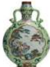
CHENE XVIII Gourde Adjugé 420 000 €