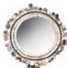
Line VAUTRIN Miroir Adjugé 95 000 €