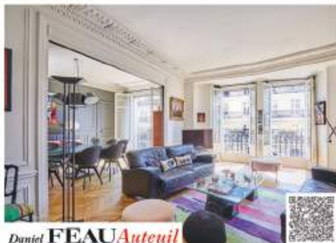
Daniel FÉAU Auteuil

Aux deux derniers étages d'un immeuble récent de standing, appartement en duplex traversant et climatisé de 163 m 2 . Il bénéficie de larges terrasses, ainsi que d'un toit-terrasse de 130 m 2 , le tout aménagé et arboré. Un vaste espace de réception ouvrant de part et d'autre sur des terrasses, comprenant un salon, une salle à manger et une cuisine ouverte, un bureau avec verrière et trois chambres dont une suite avec dressing. Une place de parking. Réf : 82966797 - Tél : 01 84 79 81 15