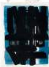
Pierre Soulagès Lithographie Adjugé 39 000 €