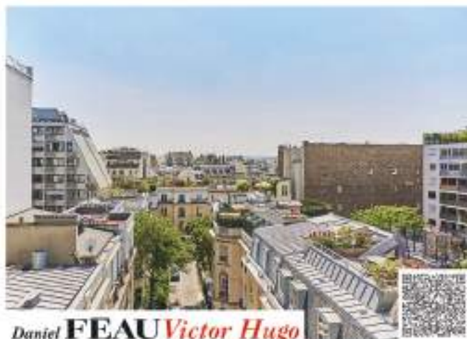
Daniel FÉAU Victor Hugo

Au quatrième étage d'un immeuble en pierre de taille, élégant appartement de 135 m 2 offrant de jolies vues dégagées. Il comprend une galerie d'entrée, une double réception ouvrant sur un balcon exposé sud-est, une cuisine dînatoire équipée et trois chambres. Une cave. Réf : 82506093 - Tél : 01 84 79 82 04