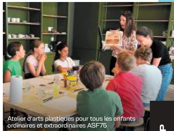
Atelier d'arts plastiques pour tous les enfants ordinaires et extraordinaires ASF75