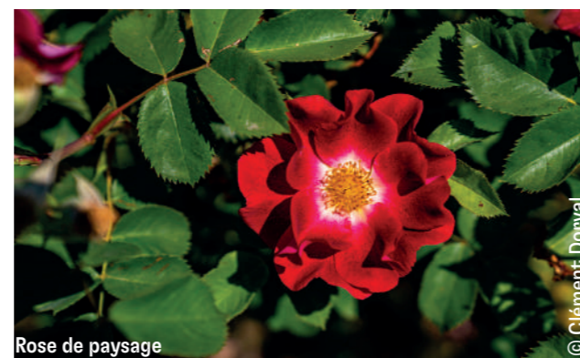
Rose de paysage