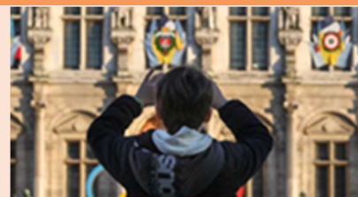
Bilan d'étape du mandat Venez rencontrer la maire de Paris et toute son équipe