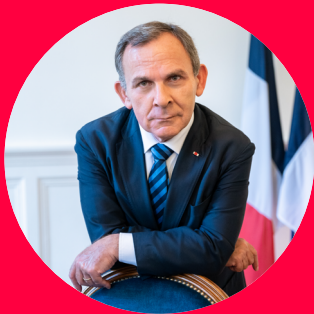
Francis SZPINER Maire du XVI e arrondissement

Les statistiques de la délinquance de cet été confirment la bonne tendance du premier semestre, dont nous faisons état ici même le mois dernier : tant pour les violences physiques contre les personnes que pour les atteintes aux biens, la sécurité progresse dans le XVI e . Ces succès, nous les devons à la vigilance des élus de l'arrondissement, à l'activité remarquable de la police nationale, au déploiement progressif de la police municipale, aux efforts de tous les services et acteurs concernés. Ces résultats pourraient s'améliorer encore si la mairie de Paris donnait à sa police municipale les effectifs, les missions et les moyens lui permettant de jouer pleinement son rôle.