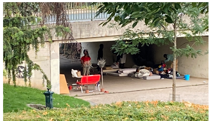
Square Roger Coquoin, des problèmes d'hygiène et de salubrité.

Les problèmes de ce type tendant à se multiplier, il faudra bien que le législateur se saisisse rapidement de ces occupations illicites de l'espace public, afin de mettre fin à une situation difficilement admissible pour les habitants.