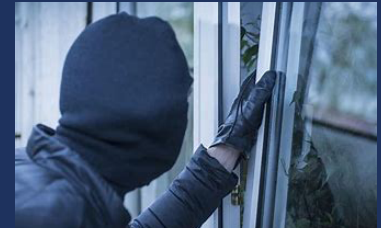
Les commerces souvent victimes de cambriolages en août.

De quoi donc se réjouir globalement. Mais certains chiffres montrent que rien n'est jamais acquis dans ce domaine, et que la vigilance s'impose. Si l'on considère les chiffres du seul mois d'août, les atteintes aux personnes progressent de 1,08%, notamment à cause des violences conjugales (+59,09%). Les atteintes aux biens, globalement en baisse de -9%, montrent une hausse des cambriolages, en particulier de ceux visant les commerces (+7,14%), ce qui s'explique sans doute par la fermeture annuelle de nombreux établissements. Autres préoccupations : les vols d'automobiles sont repartis à la hausse en août (+5,26%) ainsi que les vols à la roulotte, qui ont bondi de 37,96%. Motif de satisfaction : la part des mineurs mis en cause diminue sensiblement, tant dans les violences aux personnes que dans les atteintes aux personnes, ce qui confirme la présence nettement moins forte dans notre arrondissement de groupes de « mineurs » étrangers isolés.