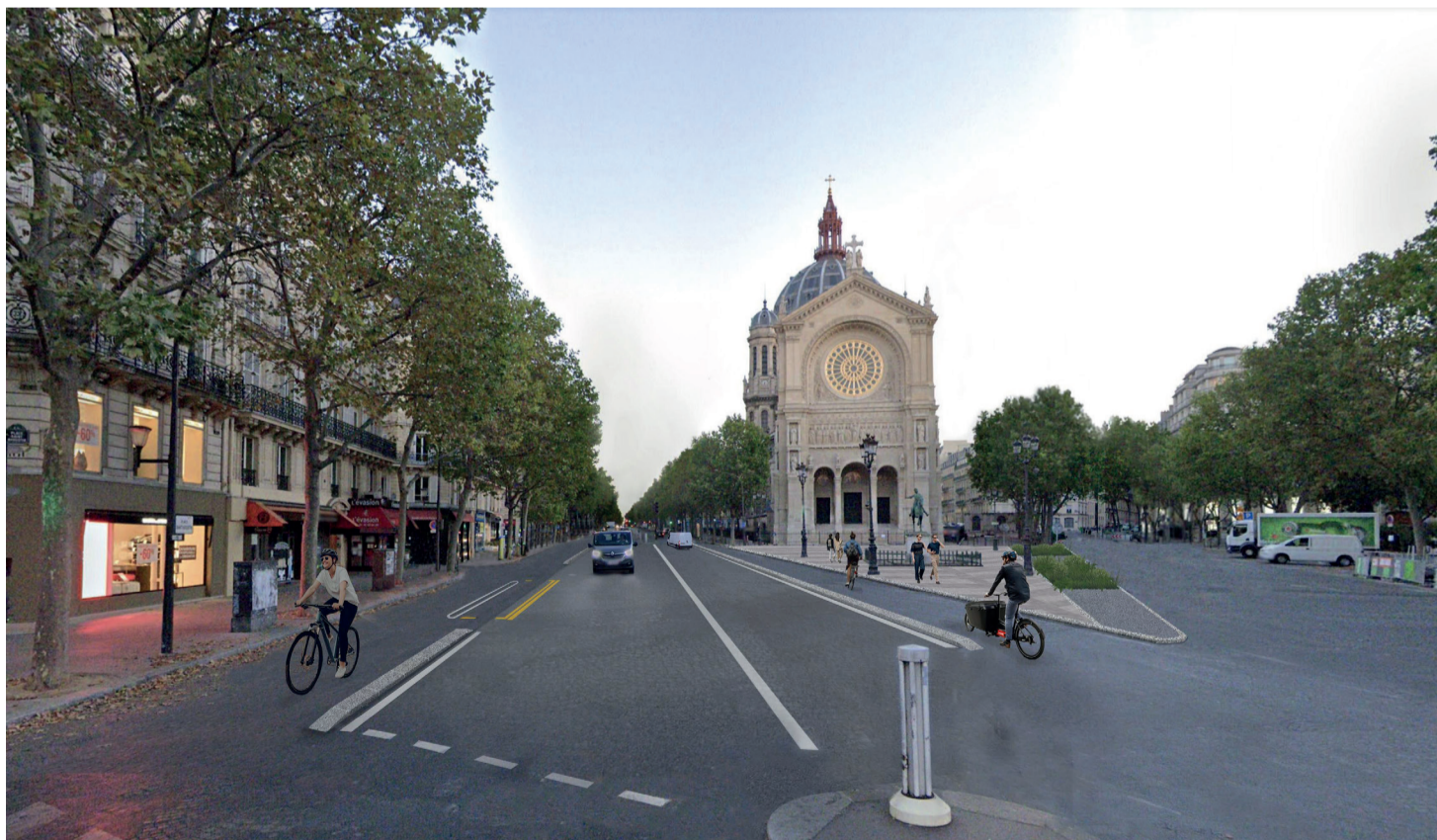
Photomontage du projet d'aménagement

Chantier en plusieurs phases, de septembre 2023 à juin 2024.