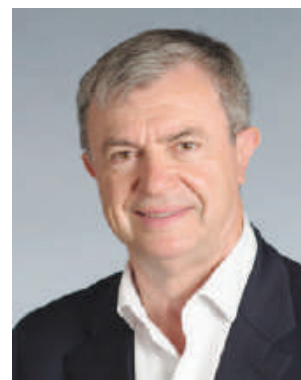
Jean-Pierre LECOQ Maire du 6 e arrondissement Conseiller régional d'Île-de-France

Nous évoquons également nos grands projets comme le devenir de l'ancienne clinique Tarnier, le musée Hébert ou les bâtiments conventuels du 110, rue de Vaugirard.