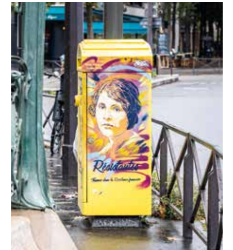
16 — Elsa Triolet 1896-1970