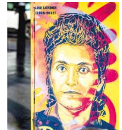
22 — Lise London 1916-2012