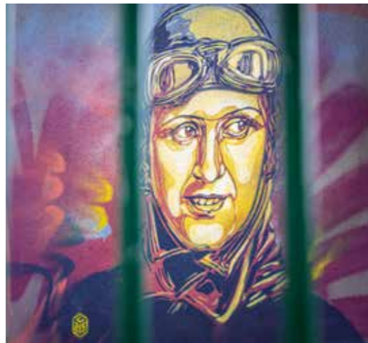
7 — Maryse Bastié 1898-1952