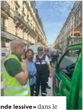
Opération « grande lessive » dans le quartier Europe, avec les équipes de la Propreté et la Police Municipale.