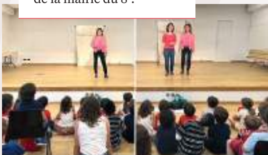
Spectacle de fin d'année de l'école Florence, à la salle des conférences de la mairie du 8 e .