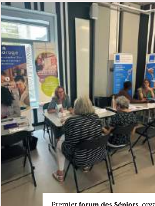
Premier forum des Séniors , organisé par l'Espace Parisien des Solidarités du 8 e et du 17 e arrondissements, à la Maison de la Vie Associative et Citoyenne du 8 e .