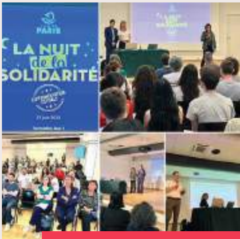
Nuit de la Solidarité estivale , un premier test dans le 8 e et le 20 e arrondissement cette année. Comme pour l'édition hivernale, elle a rassemblé de nombreux bénévoles afin de rencontrer et recenser les personnes à la rue.