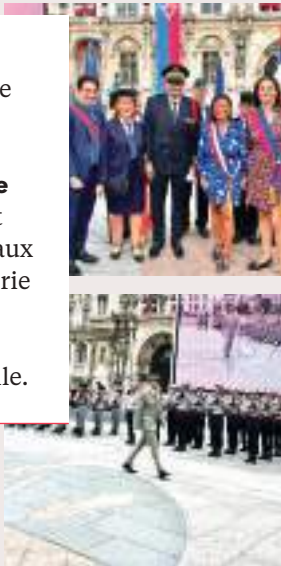
Cérémonie commémorative du 79 e anniversaire de la Libération de Paris , le 25 août au monument aux morts de la mairie du 8 e ainsi que sur l'esplanade de l'hôtel de Ville.