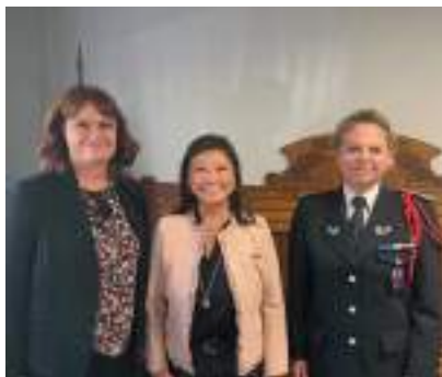
La nouvelle commissaire divisionnaire du 8 e , aux côtés du Maire et de la Cheffe de la brigade de Police Municipale.