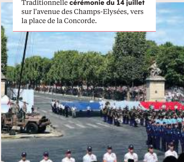
Traditionnelle cérémonie du 14 juillet sur l'avenue des Champs-Élysées, vers la place de la Concorde.