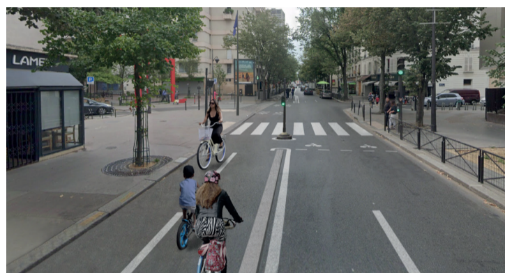
Photomontage du projet