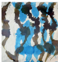
Encre sur papier - O Paraiso