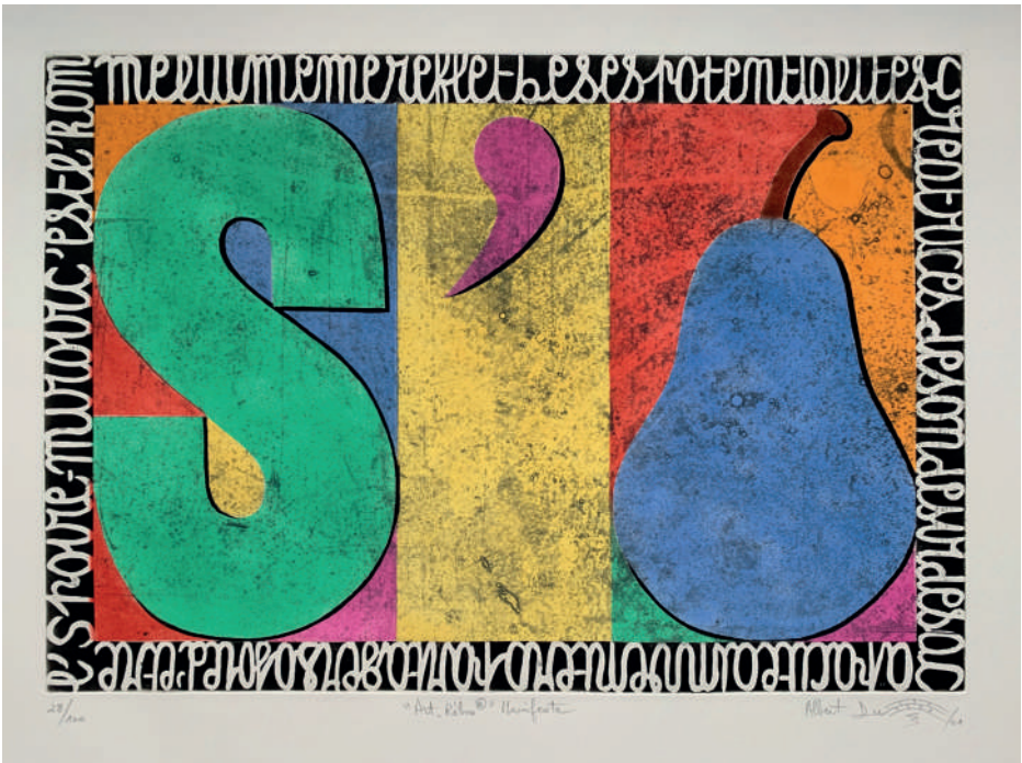
Gravure originale - S'POÏRE

"Albert Dupont attrape les mots par les cheveux, les secoue et chaque lettre révèle son être" (Roberto Matta).