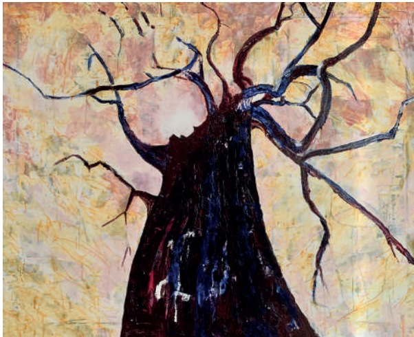
Acrylique - Folie