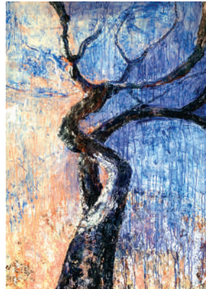
Acrylique - Belfier