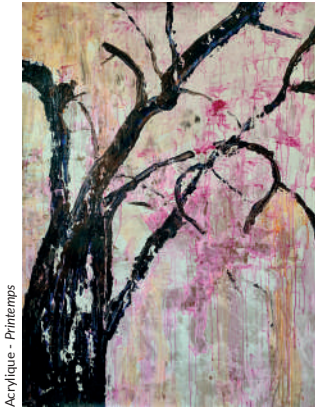
Acrylique - Printemps