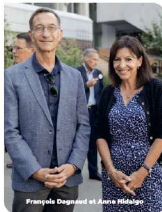
François Dagnaud et Anne Hidalgo

autour des valeurs de l'olympisme. Mais ils sont aussi et surtout une opportunité unique d'accélérer les transformations de notre ville. Avec la baignade enfin possible dans la Seine, les pistes cyclables plus nombreuses, les équipements sportifs de proximité rénovés et accessibles : les héritages seront nombreux pour permettre aux Parisiennes et aux Parisiens de vivre mieux aujourd'hui et dans les années qui viennent.