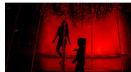
© Bernard Jolival, Le circuit de l'eau