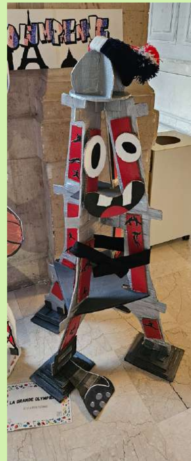
LA GRANDE OLYMPIENNE EE 57 A Reuilly (12ème)