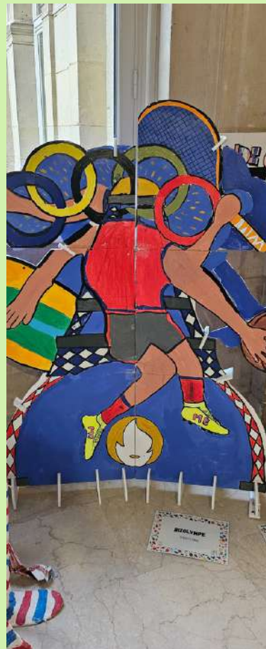
BIZOLYMPIQUE EE Michel Bizot (12ème)