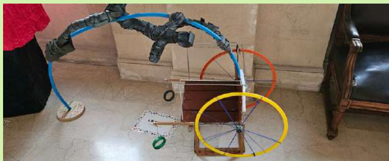
L'ALBATROS EE Baudelaire (12ème)