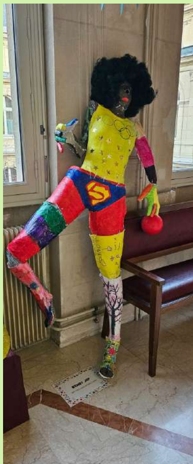
WEMBY JOP CASPE 11/12 et Hôpital Trousseau