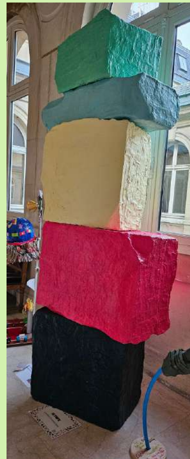
OYLMPE EE 27 Reuilly & EM 59 Reuilly (12ème)