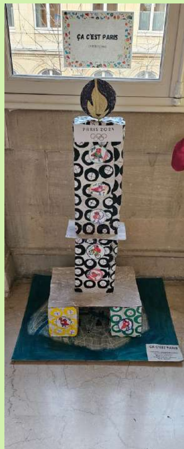
ÇA C'EST PARIS EM Merlin (11ème)