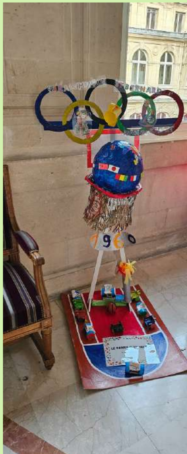
LE PANIER OLYMPIQUE EM Saint Bernard (11ème)