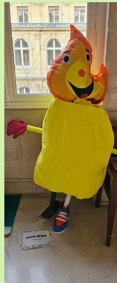
DURANLYMPIQUE EM Duranti (11ème)