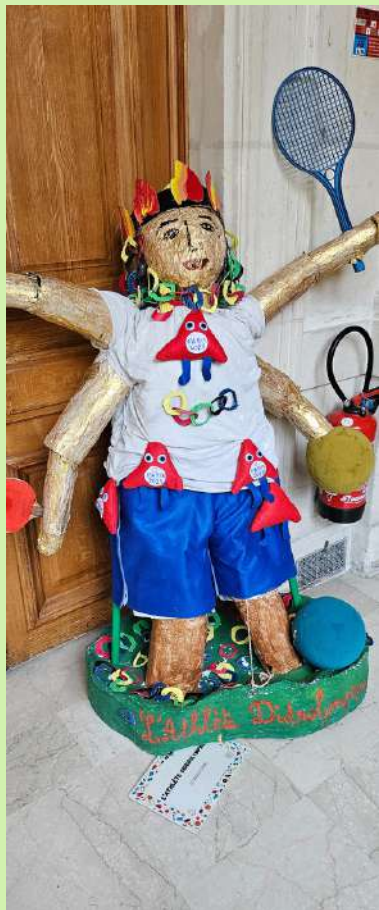
L'ATHLÈTE DIDEROLYMPIQUE EE Diderot (12ème)