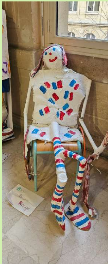
BLEU, BLANC, ROUGE EM 253 bis Daumesnil (12ème)