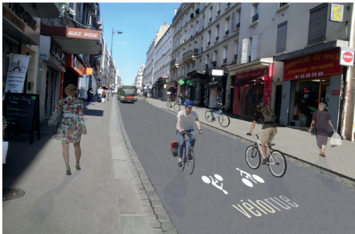
Photomontage illustrant le principe de l'aménagement

📍 Phase 3 : de début mars à fin mai 2024