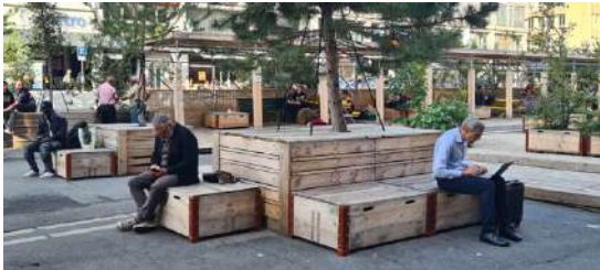
Assises en pied d'arbre à déplacer pour conserver la végétation, Lausanne