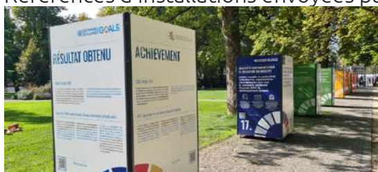
Exposition sur le climat à Genève