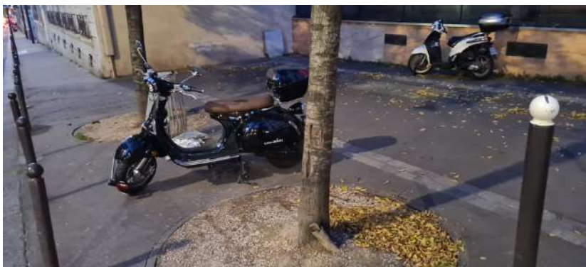
Elargissement du trottoir au niveau du n°34