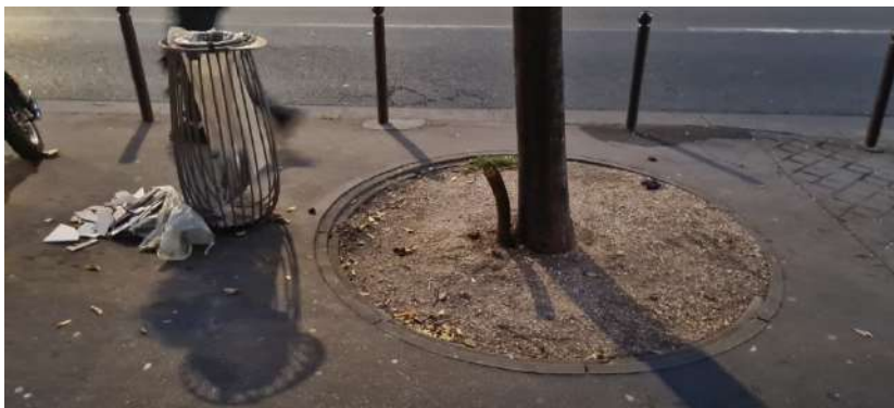
Elargissement du trottoir au niveau du n°34