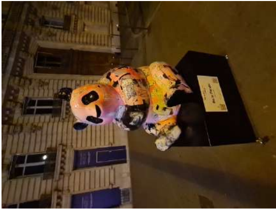
Exposition de sculpture avenue Georges V