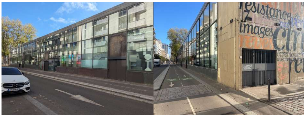
Sorties du cinéma sur la piste cyclable