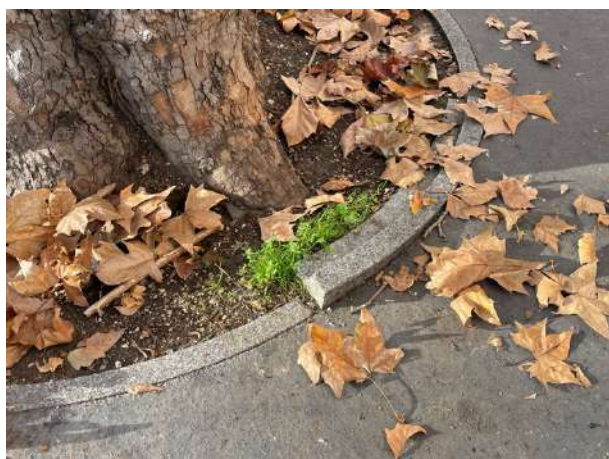
Tour d'arbre Quai de la Seine