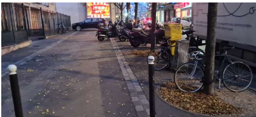
Elargissement du trottoir au niveau du n°34